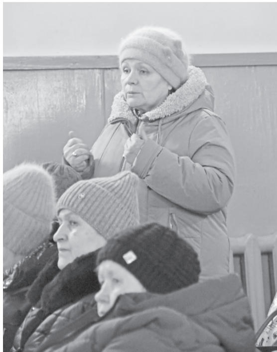
Вопрос из зала

Также жители Дубровинского поселения попросили главу