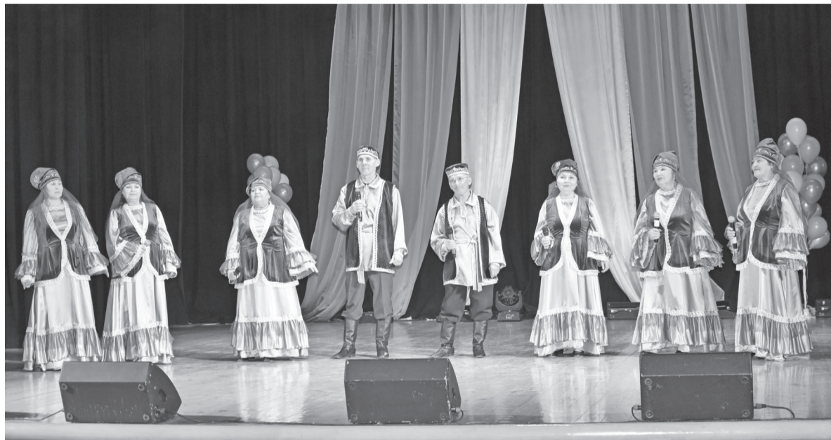
Ансамбль «Яшь йорэклар» («Молодые сердца»)

зывать зрителям и жюри свои сценические таланты в разных жанрах – хореографии, эстрадном и народном вокале, фольклоре, художественном слове. В результате чего публике удалось увидеть неординарных, ярких, эмоциональных «звездочек» почти со всего Вагайского района, которые представили более 50 номеров.