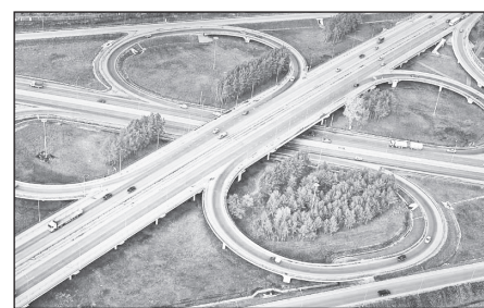
Транспортная развязка на Московском тракте – это восемь съездов общей протяжённостью 2 899 м.

Так звучит выражение на латыни, которое переводится: найди дорогу или проложи её сам. Это как нельзя лучше характеризует настрой тюменцев идти вперёд и развиваться. Наверное, каждый из тех, кто периодически навещает в областную столицу, замечает, насколько стремительно меняется её облик. За последние лет десять сделано многое для того, чтобы полностью обновить облик и атмосферу города. Тюмень уже можно отнести к числу одного из самых красивых населённых пунктов России.