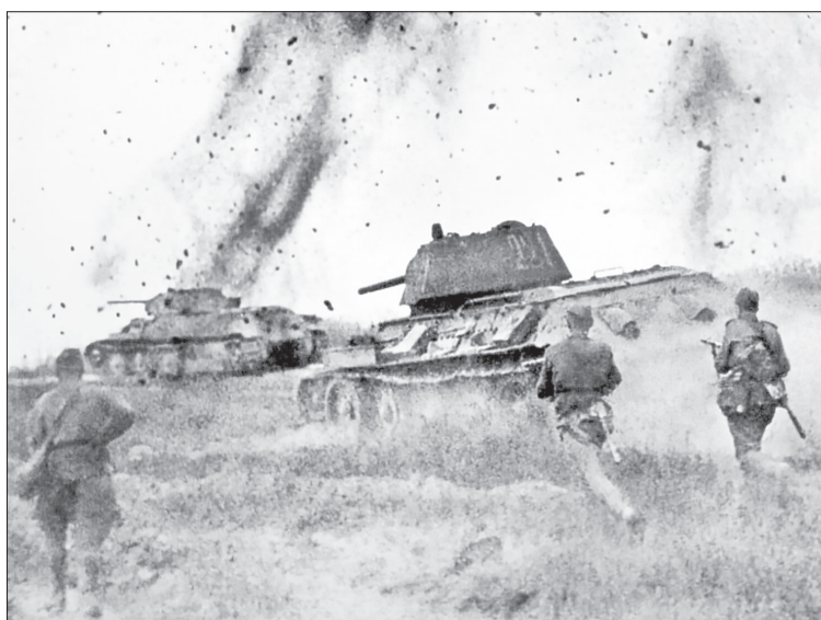
Один из самых известных снимков советского военного фотожурналиста Ивана Шагина

из своей 76-миллиметровой пушки вывел из строя почти непробиваемого «Королевского тигра», а ещё расстрелял немецкую пушку с тягачом, за что потом был представлен к медали «За боевые заслуги».