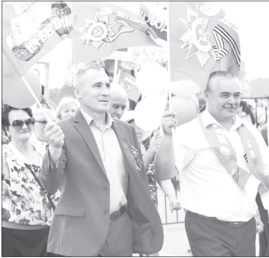
Шествие колонны Бессмертного полка начнётся в полдень

Большой районный праздник «Звенит Победой май цветущий» состоится 9 мая в селе Памятном.