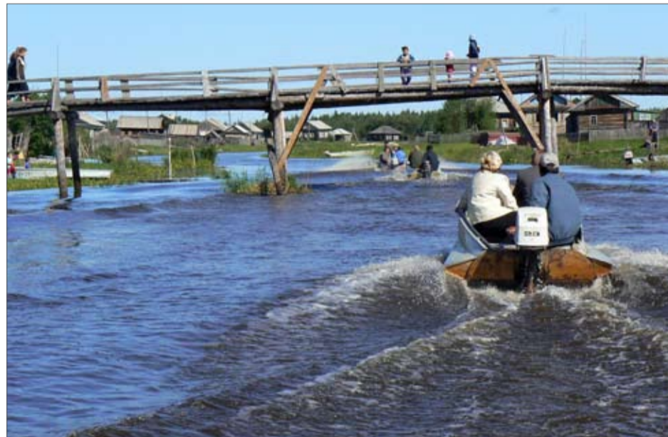
Как на трассе

Конечно, цивилизация не прошла мимо лайтамакцев. В деревне имеются сотовая связь, интернет, но, тем не менее, живут они иначе, не