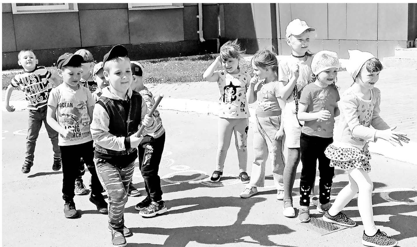
Подвижные игры на свежем воздухе – это здоровье, это радость! Детки корпуса №4 д/с «Колосок».

► 1 В летний период (с 1 июня по 31 августа) в детском саду «Колосок» реализуется образовательный проект «Летняя радуга детства». И есть в нём интересная фишка – каждый день имеет свою тематику: «День счастливых детей», «День здоровья», «День русского языка», «День игрушек», «День моряка», «День солнца» и так далее. А это означает, что каждый день для дошколят станет праздником!