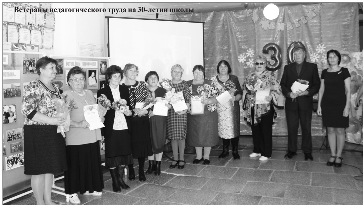
Ветераны педагогического труда на 30-летию школы