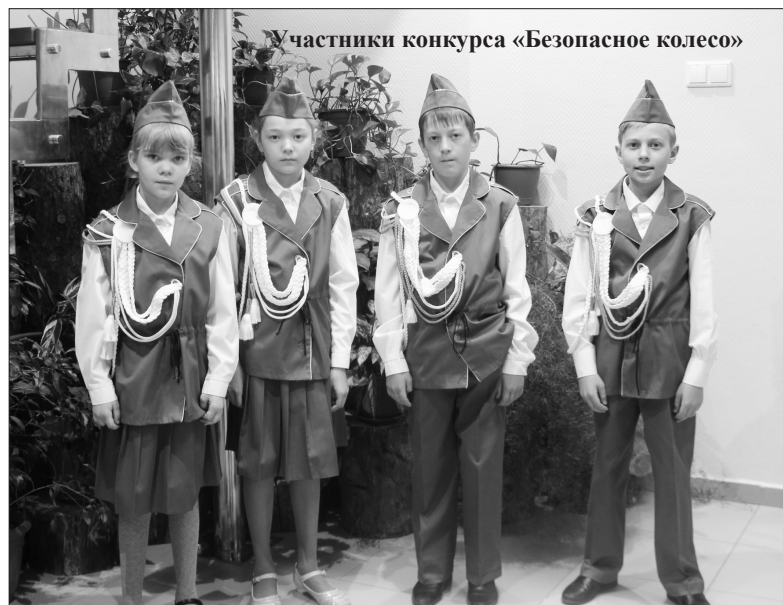
Участники конкурса «Безопасное колесо»