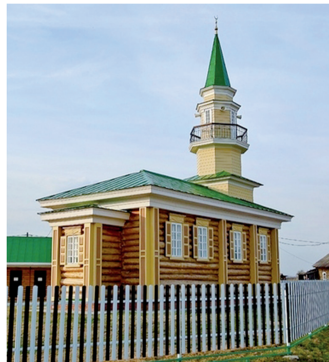
Мечеть в Юртах Иртышатских.

(он проходит в течение трёх дней) традиционно принято дарить подарки, чаще всего сладости, которые символизируют радость и благополучие. После праздничной молитвы и угощения принято ходить в гости, навещать родственников, обязательно угощать их и