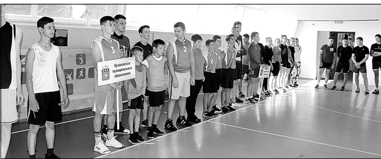
Открытие соревнований в Горьковке.

В муниципальных образованиях Тюменского района прошел первый этап Всероссийских соревнований «Оранжевый мяч».