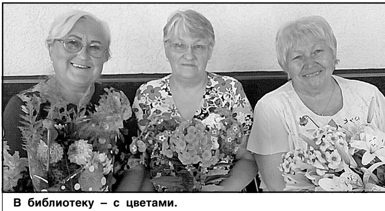
В библиотеку - с цветами.

В Каменской сельской библиотеке прошло мероприятие «И цветы умеют говорить».