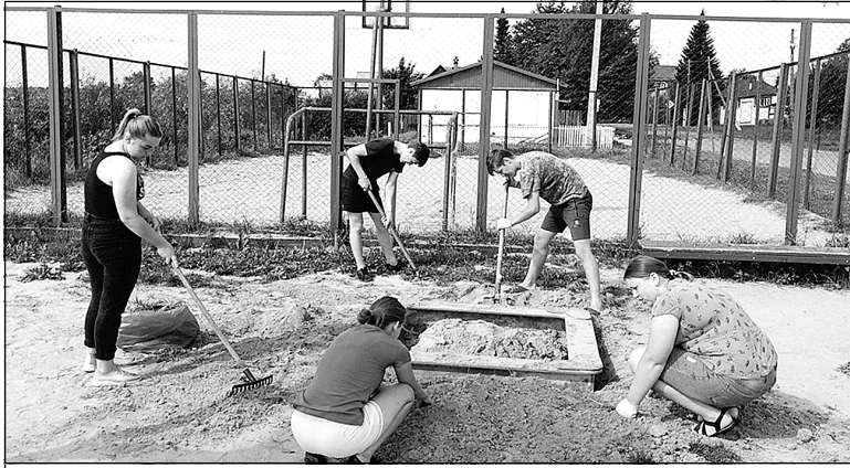
Основная задача «муравьев» - благоустройство.

Впервые на территории села Гусево на основе территориального общественного самоуправления создан отряд «муравьев».