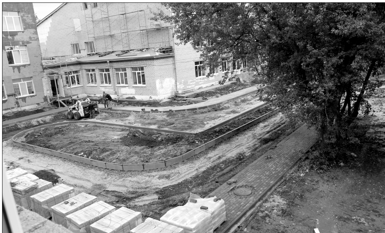
К 1 сентября школа обновится.