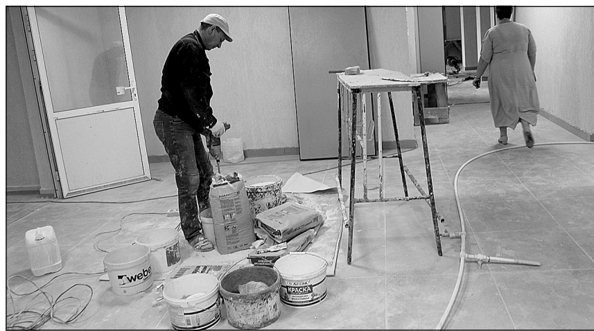
Ремонтные работы в полном разгаре.