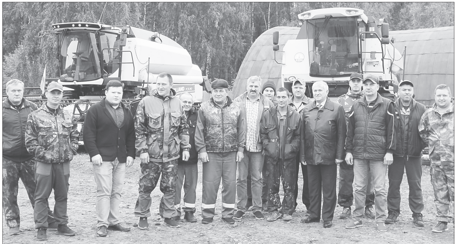
Земледельцы «Приозёрного» уборочную страду в этом году начали раньше обычного - 26 июля

Коллектив АО «Приозёрное» первым в районе завершил уборку зерновых