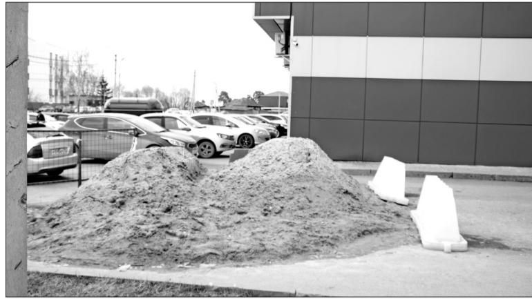
📷 Работы по реконструкции сетей водоотведения на улице Первомайской в центре города завершены. Теперь нужно привести в порядок прилегающую территорию.

Теперь работникам Южного филиала АО «СУЭНКО» остаётся лишь восстановить нарушенное в ходе реконструкции благоустройство территории. Это будет сделано уже в мае.