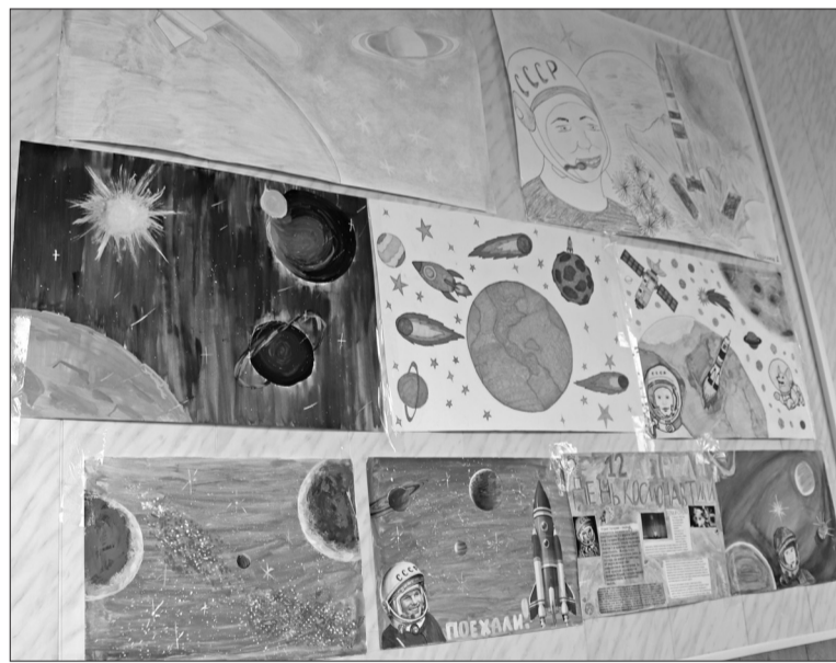
📷 Каждый из рисунков участников «космического» вернисажа в колледже по-своему интересен.