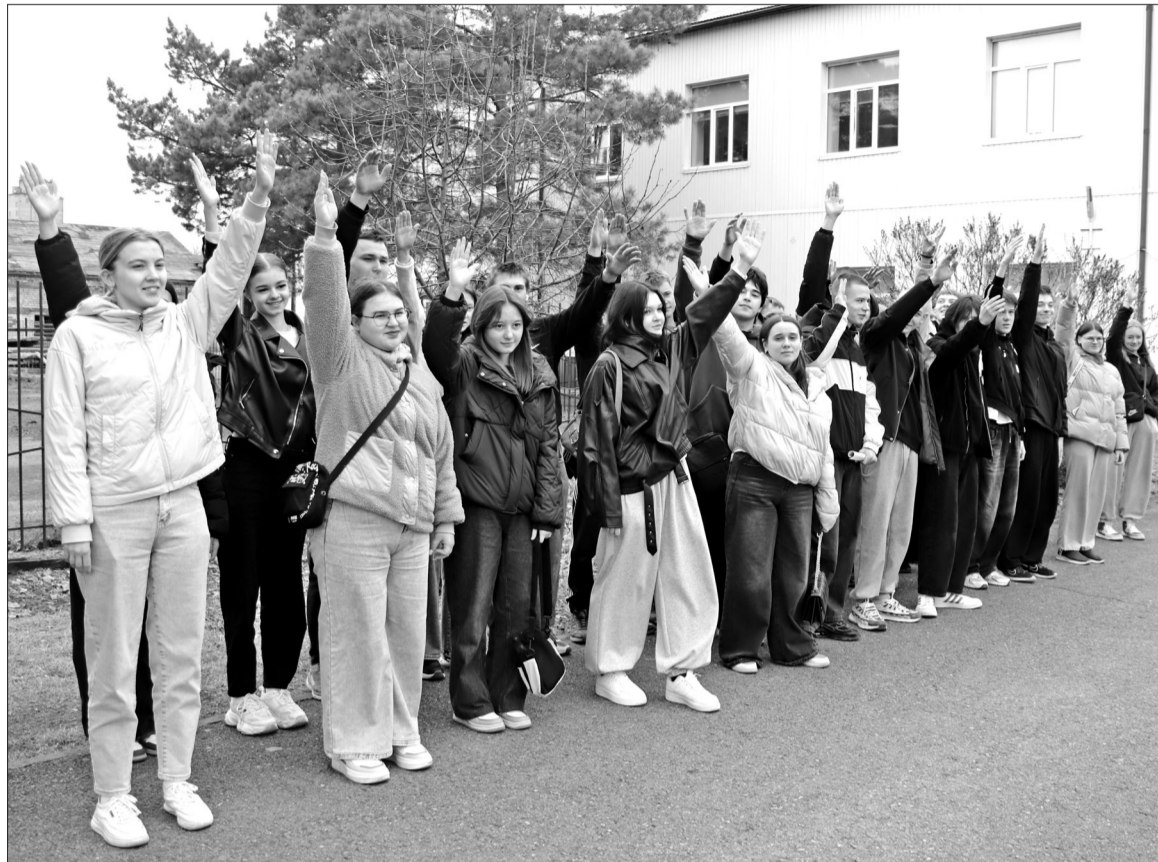
📷 Студенты Заводоуковского отделения агротехнологического колледжа участвовали в флешмобе «Улыбка Гагарина». Ребята символически повторили действия первого в мире космонавта перед стартом корабля «Восток»: улыбка, фраза: «Поехали!» и взмах рукой.

Акция. Заводоуковские студенты отмечают День космонавтики