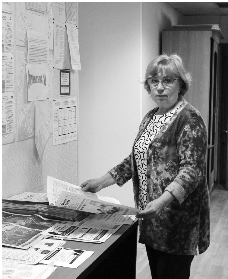
Рабочие моменты специалиста сельской администрации

Занималась предпринимательской деятельностью, розничной торговлей продуктами питания, но при-