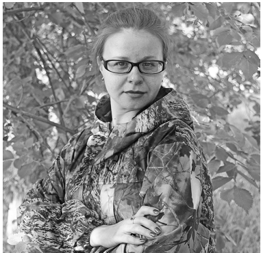
Текст и фото Анастасии ГАЦАЕВОЙ

...Знаете выражение: «В трёх соснах заблудиться»? Так вот, я из тех экземпляров, которые заплутают в двух осинках, а то и вовсе будут нарезать круги вдоль одной берёзки. Абсолютно не лесной человек. К чему это? А к тому, что на днях мне досталось проверить на себе одну из специальностей в сфере лесного комплекса. Причём ключевое слово в этом предложении – «досталось».