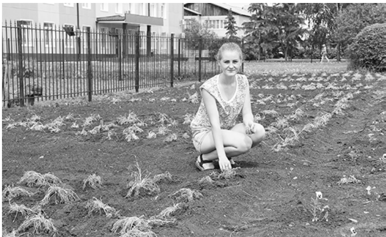
* «Решила поработать на каникулах»