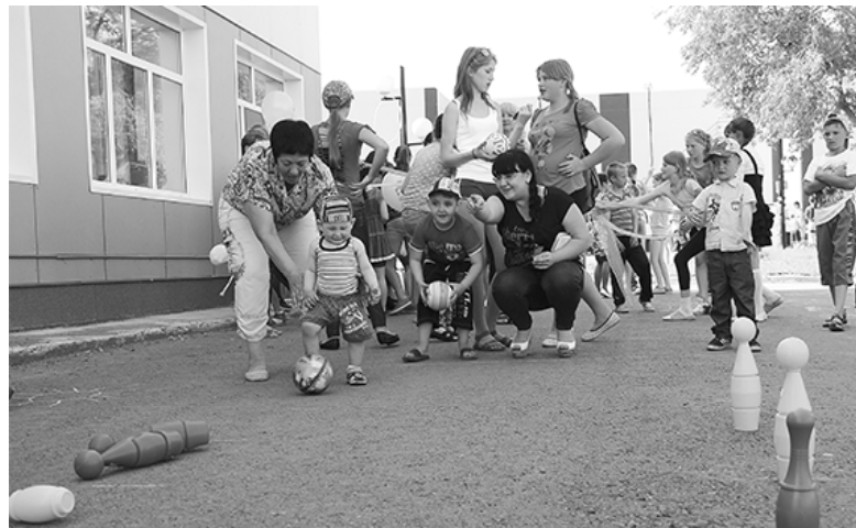
* «Играем, веселимся, забавляемся»