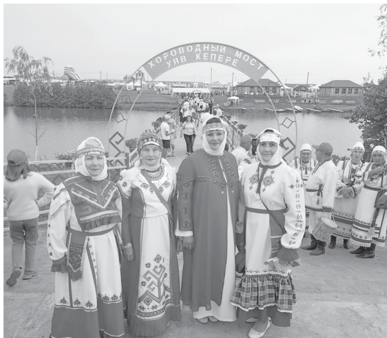
Участницы праздника «Уяв» из Ярковского района

Алина КАТКОВА, фото из архива участников праздника