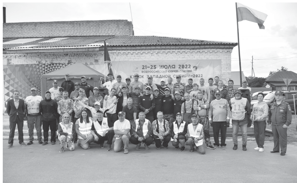
Впереди участников ждали два тура увлекательных состязаний

В общекомандном зачёте уверенную победу одержали тюменские рыбаки. При этом у спортсменов, представляющих наш регион, в командном первенстве не только «золото», но и «бронза». На втором месте – команда Свердловской области.