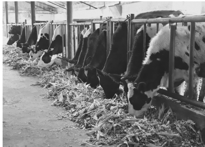
На ферме в деревне Садовщикова практикуют беспривязное содержание крупного рогатого скота

Наталья ГЛАДКОВСКАЯ