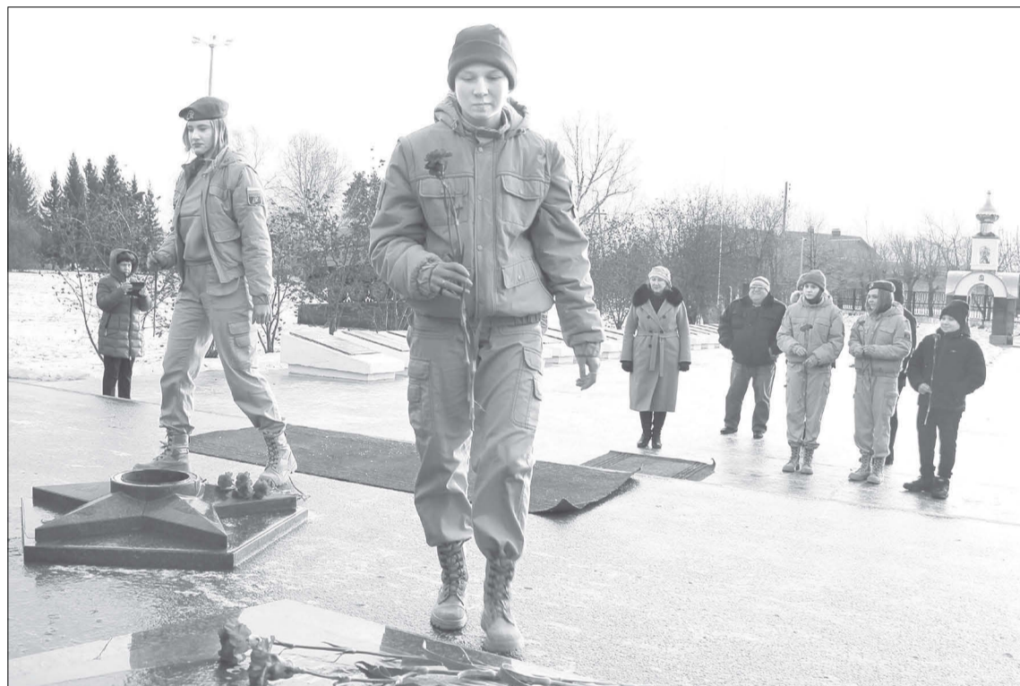
3 декабря - в День Неизвестного Солдата - юнармейцы возложили цветы к памятнику «Во имя Родины»

Сам мемориальный комплекс появился в Ялуторовске в 1990 году по инициативе совета ветеранов. Его формированием и установкой па-