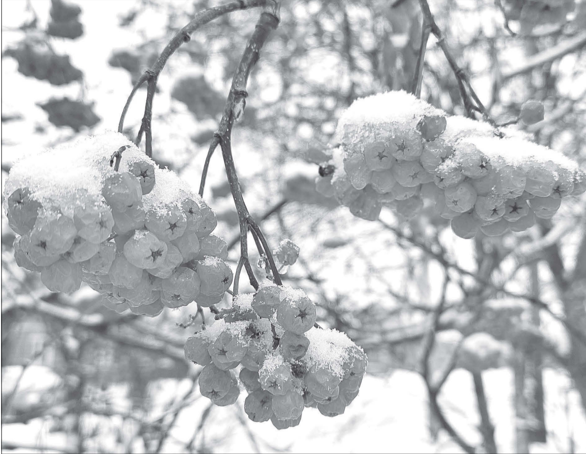
Гроздья рябины пылают среди снега