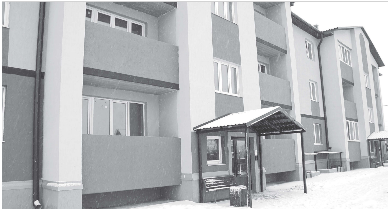
Площадь однокомнатных квартир в доме примерно одинакова и составляет от 31,9 до 33,9 кв. м