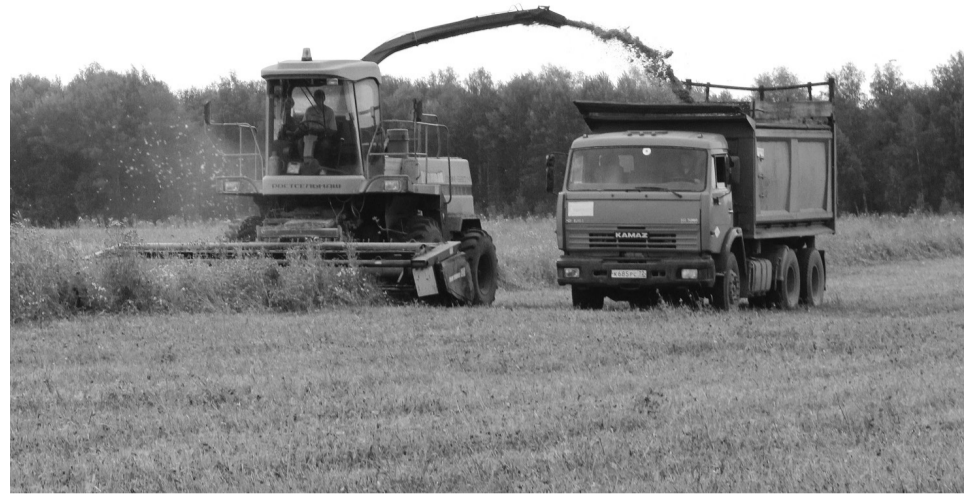
Механизаторы в полях на заготовке кормов находятся весь световой день

Приступили аграрии и к заготовке сочных кормов. Практически полно-