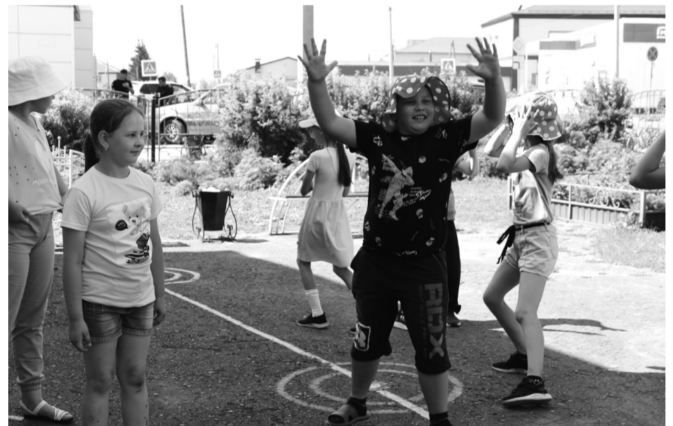
На снимке: жители волшебного мира русских сказок

– Я, как начальник лагеря, хотел рассказать об одном из дней второй смены, утро которого 14 июля началось с минутки здоровья «Вода – наш лучший друг» и активной зарядки, потому что нашим ребятам предстояло участие в «Весёлых стартах» в спорткомплексе «Сибирь». В этот раз наш лагерь пред-