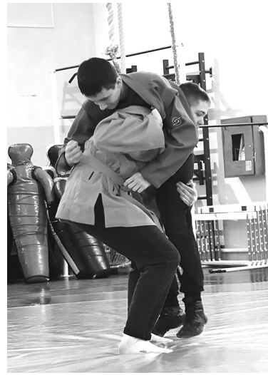
Ребята сразу же опробовали подаренную форму на ковре