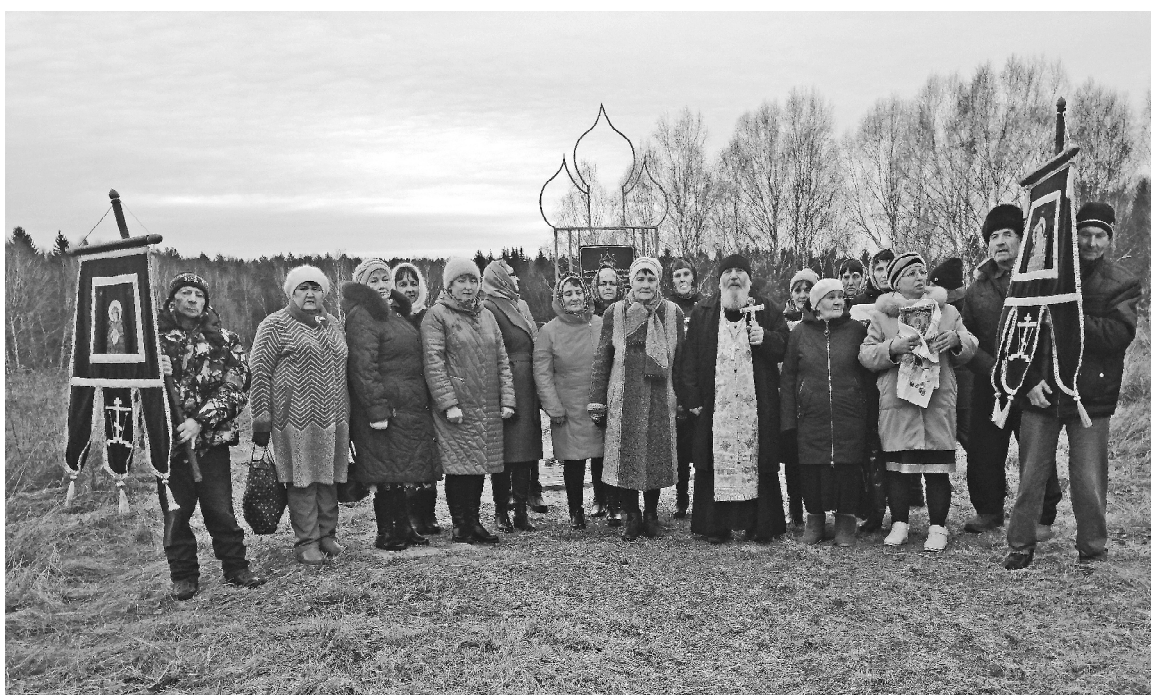
Общее фото в день открытия стелы