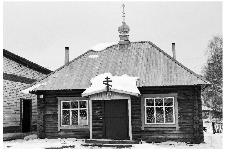
➤ Молебный дом в Ермаках