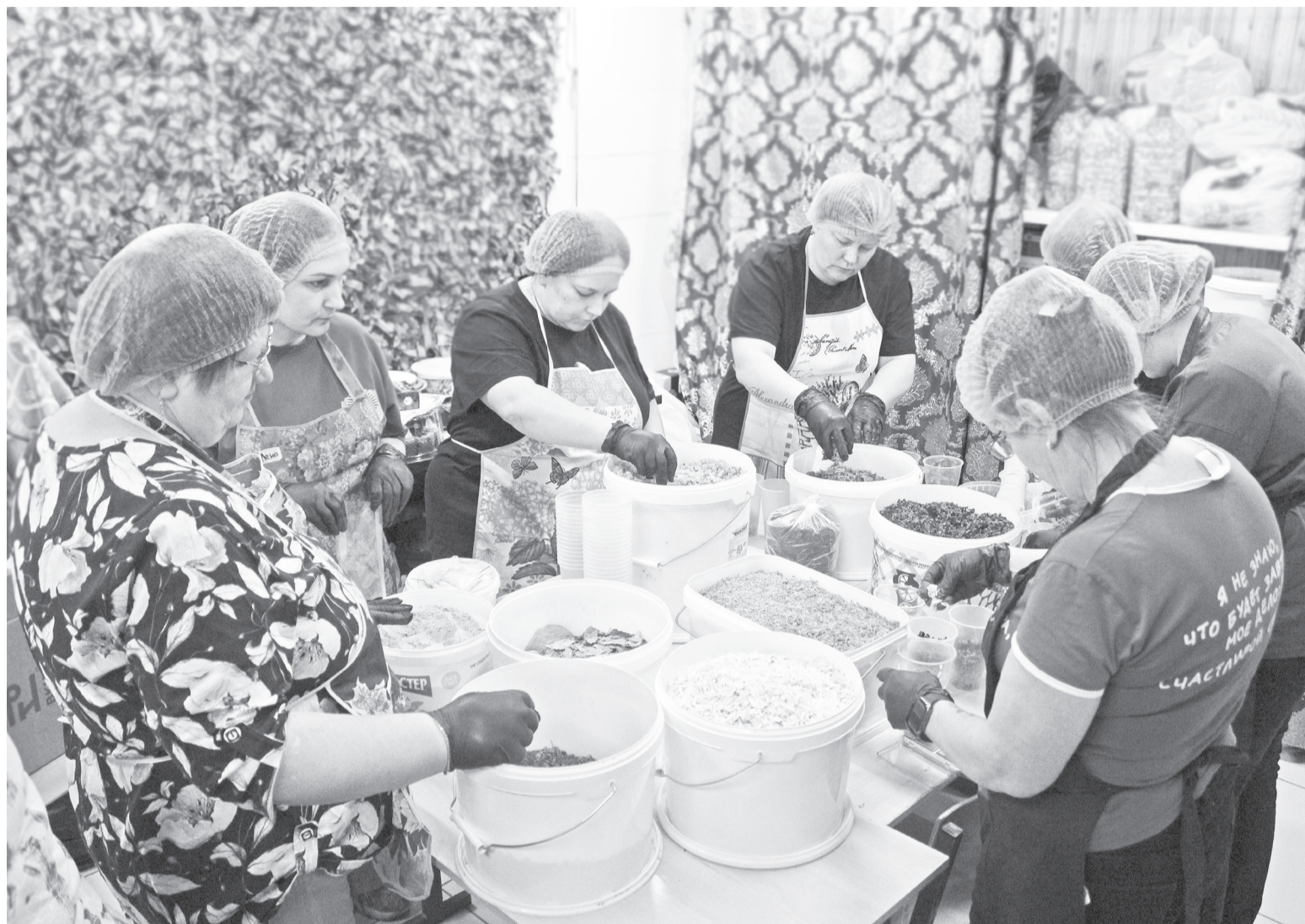
|| В штабе группы "За СВОих" идёт фасовка сухих супов.