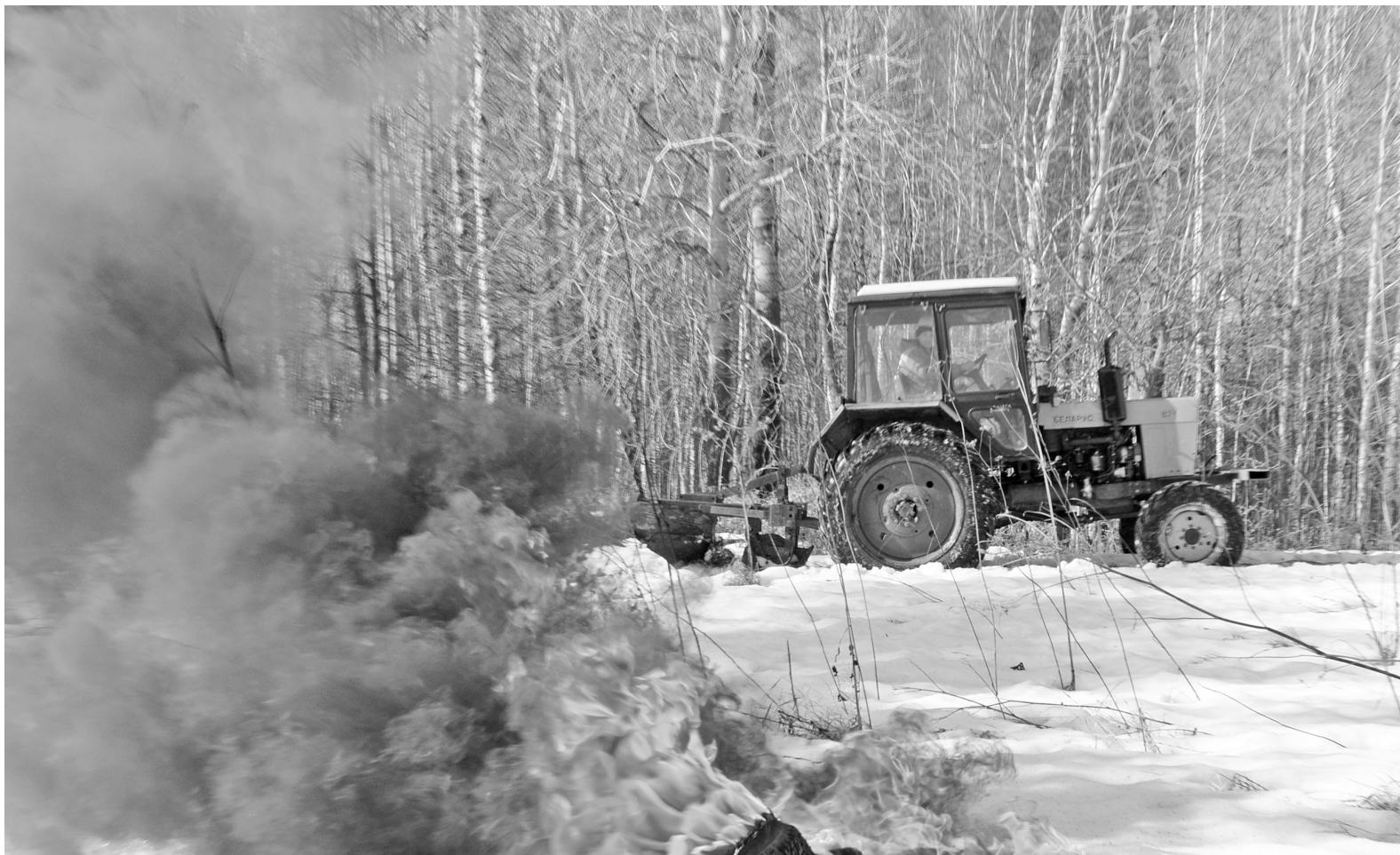
Ситуация взята под контроль. Территория опашана минерализованной полосой.

Губернатор Тюменской области объявит о наступлении пожароопасного периода (и не только в лесах) в начале третьей декады апреля. Но это совсем не значит, что нам ещё какое-то время можно расслабляться и попросту любоваться прелестью преображения природы. Скорее всего, это время