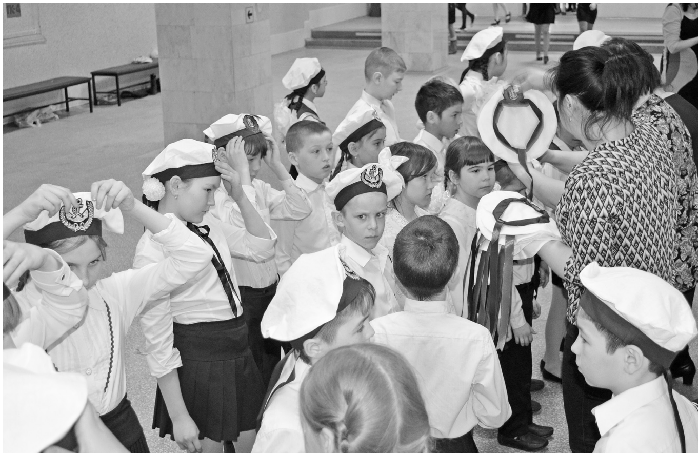
Последние минуты перед выступлением...

19 самых музыкальных и поющих коллективов-классов собрались на районном фестивале-конкурсе, чтобы определить, кто из них лучше, кто будет представлять наш район на областном уровне.