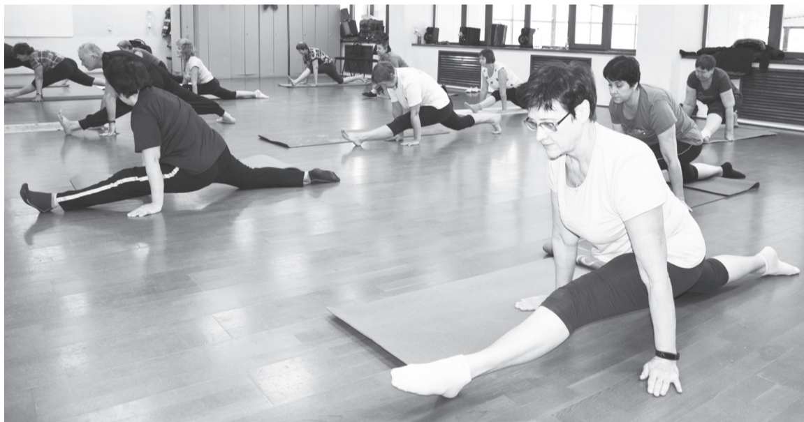
Для женщин это упражнение не проблема.

Обоснованные возражения относительно размера и местоположения границ, выделяемого в счёт земельных долей из земельного участка, необходимо направлять по адресу: 627180, Тюменская область, Упоровский район, с. Упорово, ул. Володарского, 35, оф. 1, ООО «Строительные решения» в течение 30 дней со дня опубликования данного извещения.