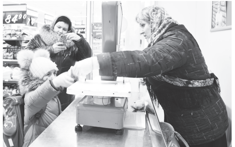
Многие ребята «блокадный хлеб» получали по несколько раз. Очень уж он им понравился.

Следует напомнить, что суточная норма хлеба в блокадном Ленинграде составляла 250 грамм для рабочих военных оборонных предприятий и 125 г – для детей, служащих и иждивенцев.