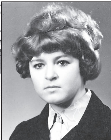
В студенческие годы

Как и на любой другой стройке, студенты жили не работой единой – кипела бурная, насыщенная, полная задора и огня жизнь. Праздновали традиционное открытие и закрытие. К открытию для всех была шита по индивидуальным меркам единая форма. С символикой и атрибутикой, лычками и шевронами. На день Ивана Купала купались в речке и пели комсомольские песни у костра. Устраивали дискотеки. Будущие украинские инженеры влюблялись в будущих педагогов, а к концу смены конкретно объявились несколько пар, которые потом стали молодожёнами. Много разных мероприятий проводилось для неугомонного временного населения Заречного, но главной заповедью был ударный ответственный труд. Ранний подъём – и до десяти вечера стройка.