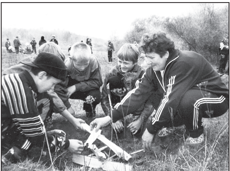
На школьном турслёте