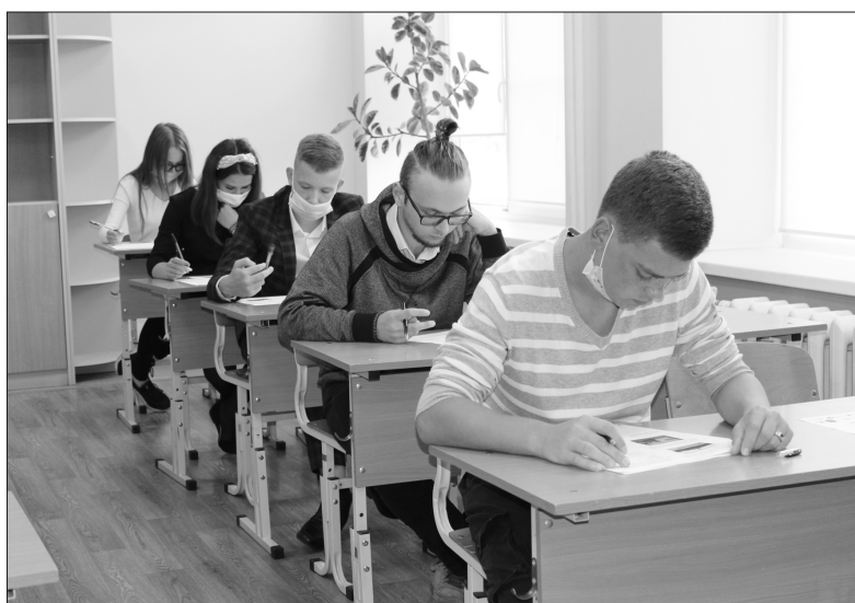
Учащиеся 11 класса Абатской СОШ № 1