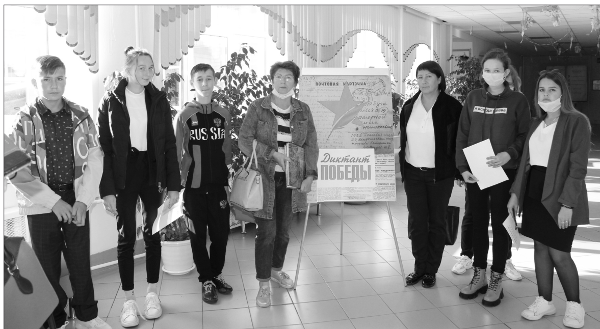
Представители Тушинолововской СОШ