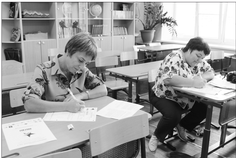
Педагоги образовательных учреждений тоже сели за парты

ловечества. Ключевую роль в Победе сыграл Советский Союз. Советские солдаты гнали врага до самого Берлина, изгоняя его с территорий других государств, захваченных нацистской Германией и её союзниками. Последняя точка во Второй мировой войне была поставлена Красной Армией на Дальнем Востоке. Блестяще проведённая Маньчжурская операция стала завершающей битвой, после которой последний союзник нацистской Германии - милитаристская Япония была вынуждена капитулировать. 2 сентября Япония подписала Акт о безоговорочной капитуляции, а 3 сентября Советский Союз праздновал Великую Победу. В 2020 году этот день объявлен Днём воинской славы России - Днём окончания Второй мировой войны. Мы должны помнить и чтить подвиг наших предков и их вклад в мир-