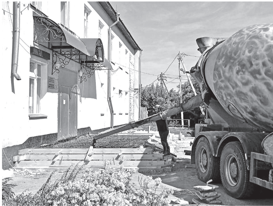
• В Новолыбаево идёт ремонт входной группы Дома культуры. Строители уже залили крыльцо бетоном, скоро здесь положат плитку и сделают удобный пандус.

В Шестаково же на этой неделе строители приступили к ремонту кровли.