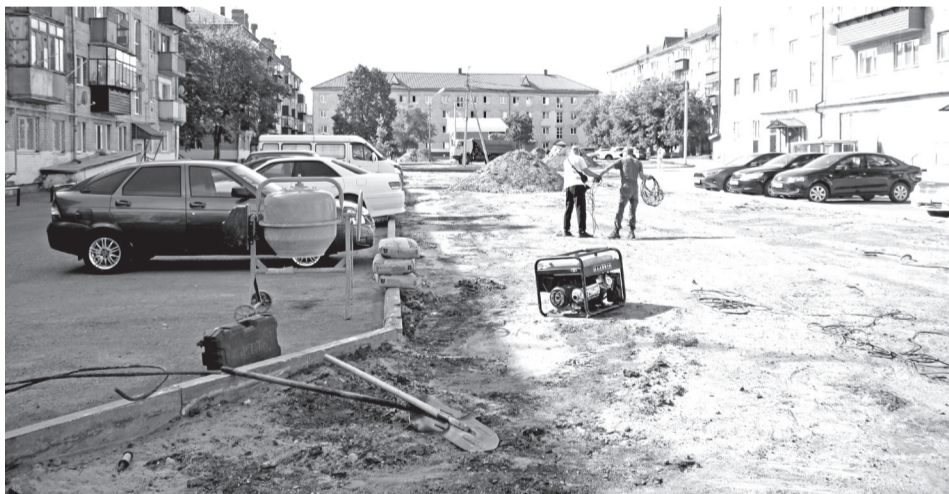
• Просторный двор между домами №№ 1 – 5 на улице Шоссейной в микрорайоне машзавода в Заводоуковске скоро будет не узнать!