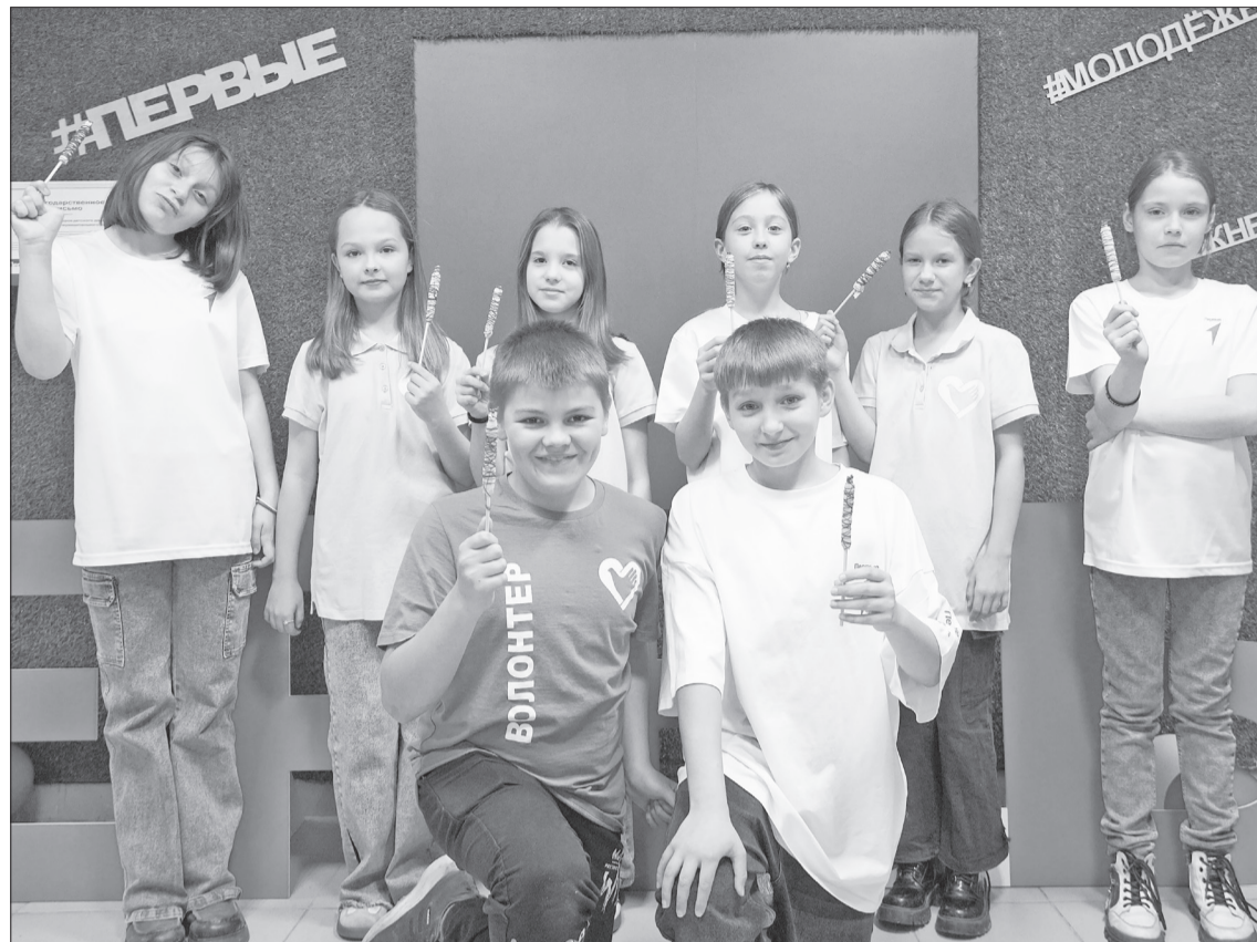
Активисты местного отделения «Движения первых» и волонтеры отряда «72 регион», освоившие процесс изготовления спичек длительного горения.

«Добрые» плюсы при поступлении в ссузы. Примечательно, что как раз под закат октября Министерством просвещения РФ законодательно установлена