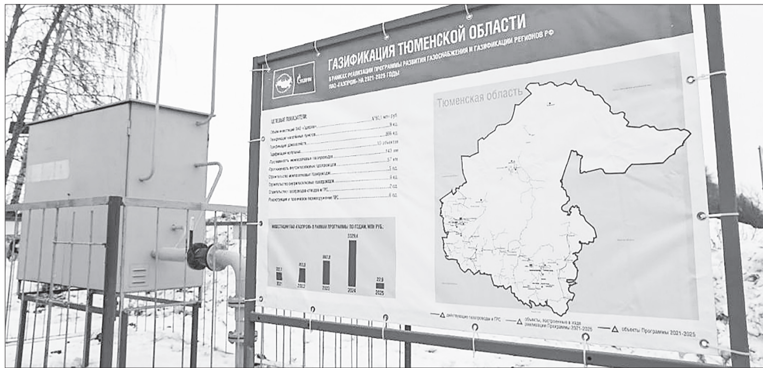
До 2028 года газ будет введён в более 34 тысячи домовладений и 95 СНТ.