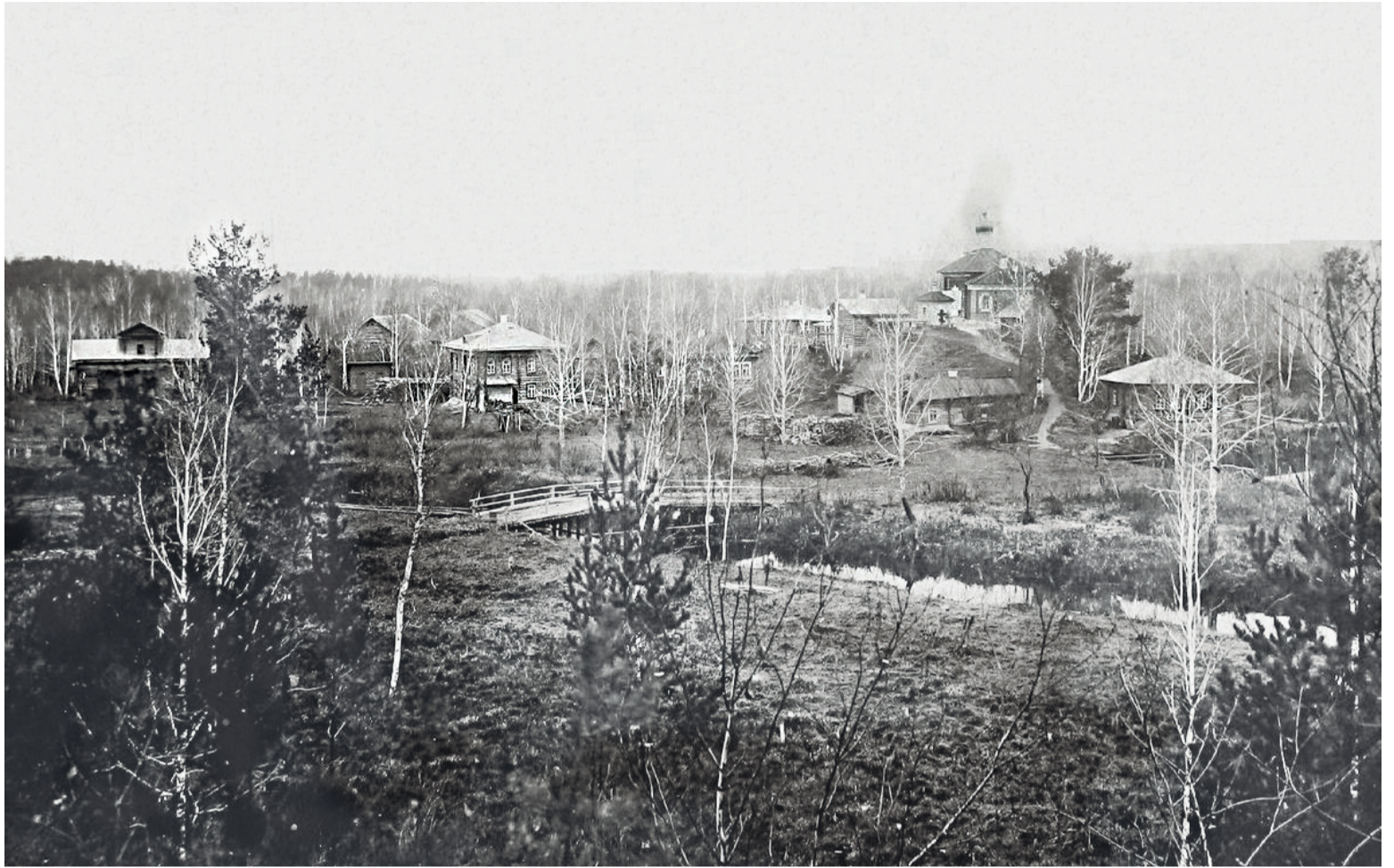
Единственное сохранившееся фото Суклёмского Троицкого мужского монастыря. 1910 год.