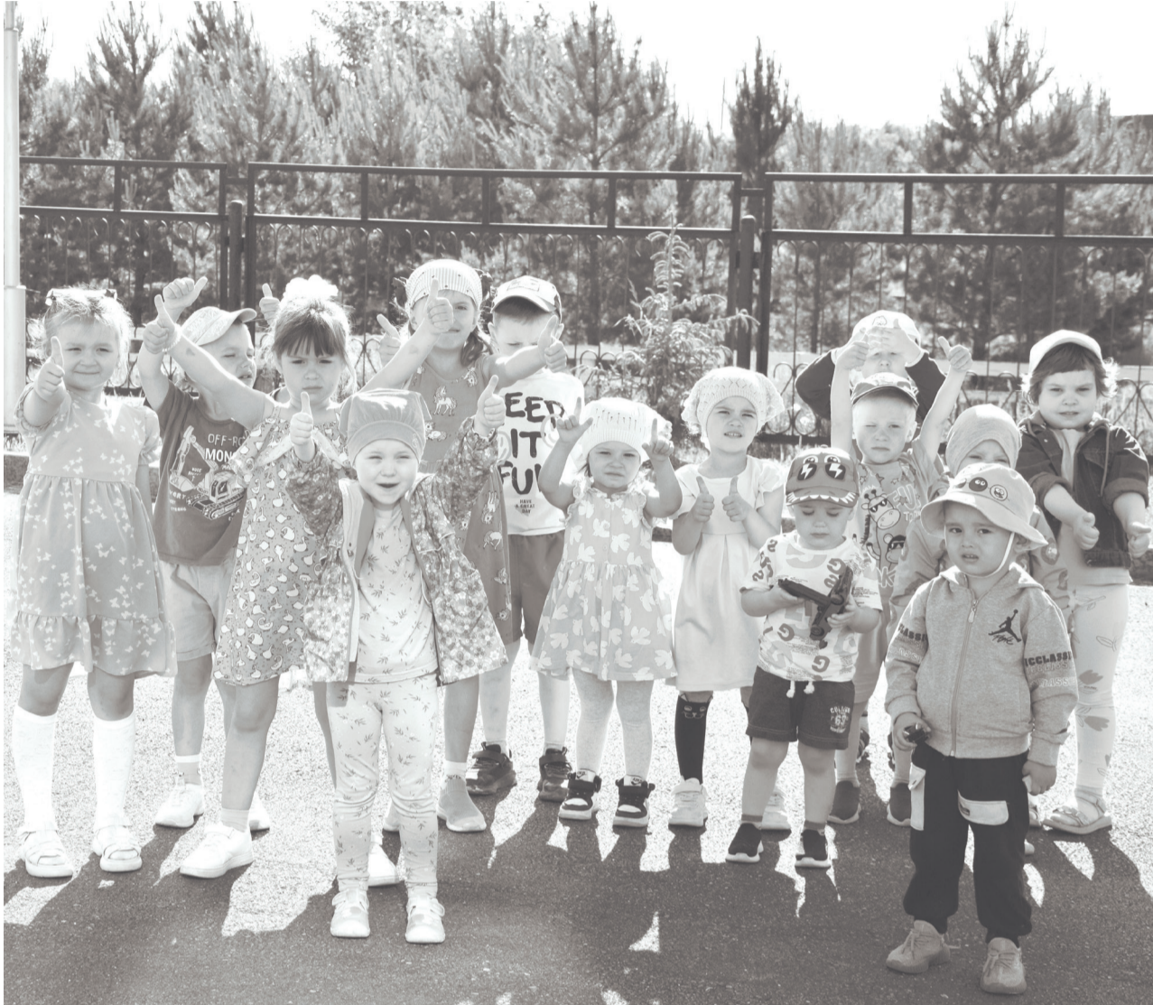
Бызовские ребята с удовольствием посещают детский сад.