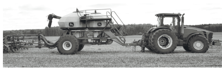
В СПК «Емуртлинский» эксплуатируются мощные посевные комплексы.

Чтобы вегетационный период растений протекал оптимально, сколько дел надо ещё прокрутить... Механизаторы «Емуртлинского» начали врезать минеральные удобрения под рапс. Для этого эксплуатируют агрегат СЗП-3,6. В дальнейшем, по словам главного агронома предприятия,