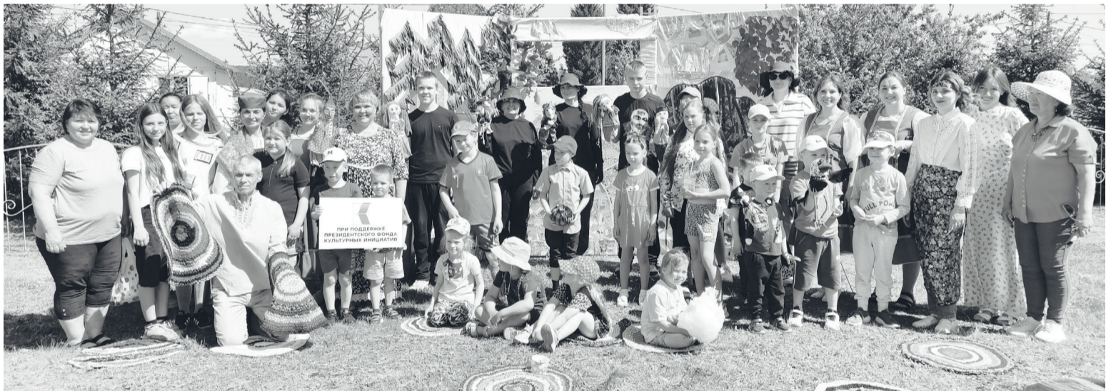
Зрители балаганного представления на Никольской ярмарке.