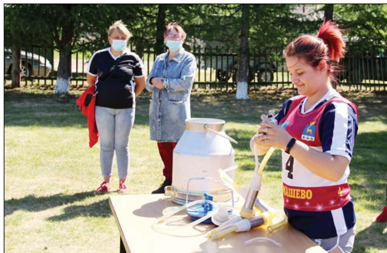
• Навыки разборки и сборки доильного аппарата спортсмены показывают на первом этапе.

Лучшей в мини-футболе стала команда Юрминского сельского поселения. Второе и третье места у дружин «Фортуны» и Новопетровского сельского