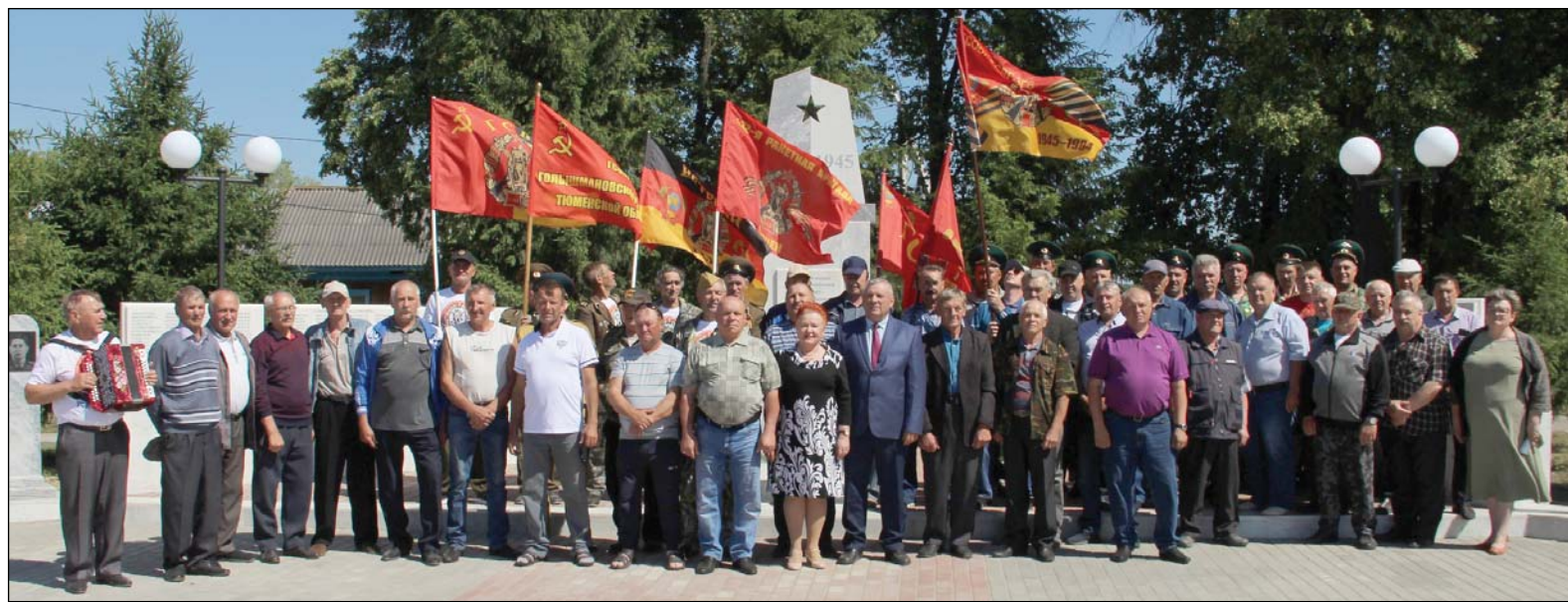
• Дан старт образованию общества ГСВГ.

– Осенью этого года исполнится 40 лет с того дня, как меня призвали в ВВС ГСВГ, о чём я нисколько не жалею. Благодаря армии я в советское время побывал в трёх зарубежных странах, и посчастливилось посетить футбольный товарищеский матч между СССР и ГДР. До сих пор помню, кто забил голы, это были Евтушенко, Оганесян и Блохин. Пребывание в Германии запомнилось не только службой, но и вот такими выходами в город, своего рода экскурсиями. Служил я в гвардейском истребительном полку имени Богдана Хмельницкого, состоящем из лётчиков-асов, мастеров своего дела. Глядя на этих звёзд и мы, солдаты, старались делать всё то, что от нас зависело наилучшим образом. Я счастлив, что служил именно там.