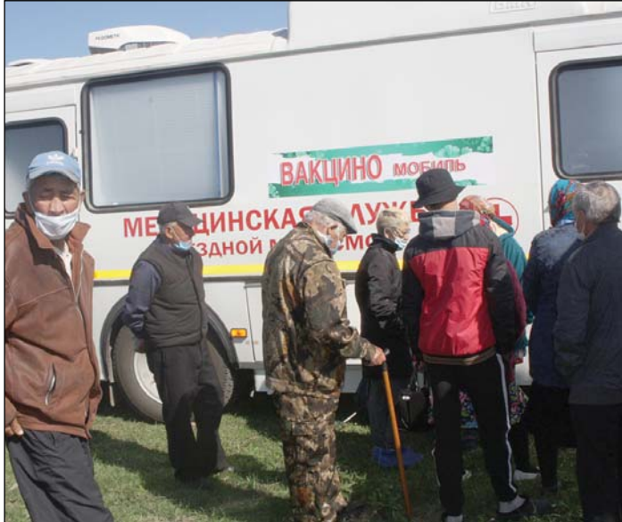
• Мобильный комплекс – возможность для жителей района получить медицинские услуги, не выезжая из села.

Информация берётся из собственных данных фонда, Единой информационной системы социального обеспечения (ЕГИССО) и системы межведомственного взаимодействия, куда в том числе поступают данные Федеральной налоговой службы. Представить доходы понадобится только в том случае, если один из родителей является военным, спасателем, полицейским или служащим другого силового ведомства, а также, если кто-то в семье получает стипендии, гранты и другие выплаты научного или учебного заведения.