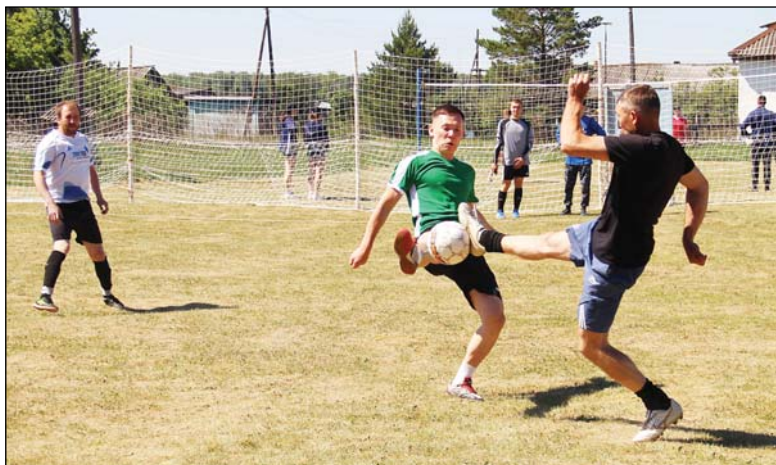
• Напряжённая борьба за мяч среди мини-футболистов.

Победители и призёры соревнований были награждены медалями и грамотами соответствующих степеней, а команды-победители кубками и грамотами.