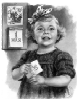
Поздравлю с праздником!

Поздравляю Вас с праздником Весны и труда!