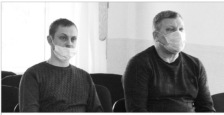
Предприниматели внимательно слушали выступающих