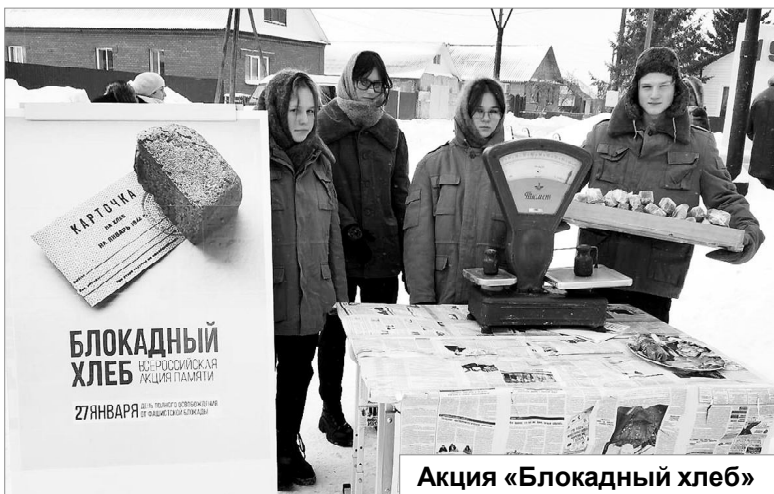
Акция «Блокадный хлеб»