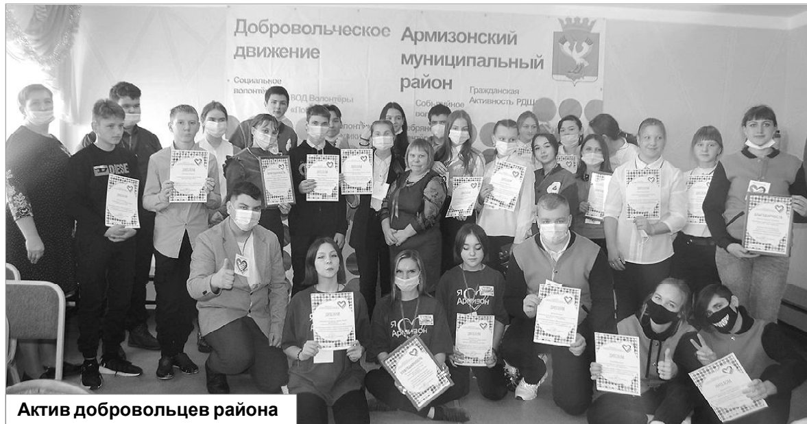
Актив добровольцев района