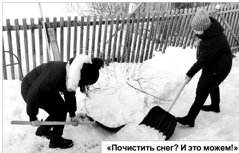
«Почистить снег? И это можем!»