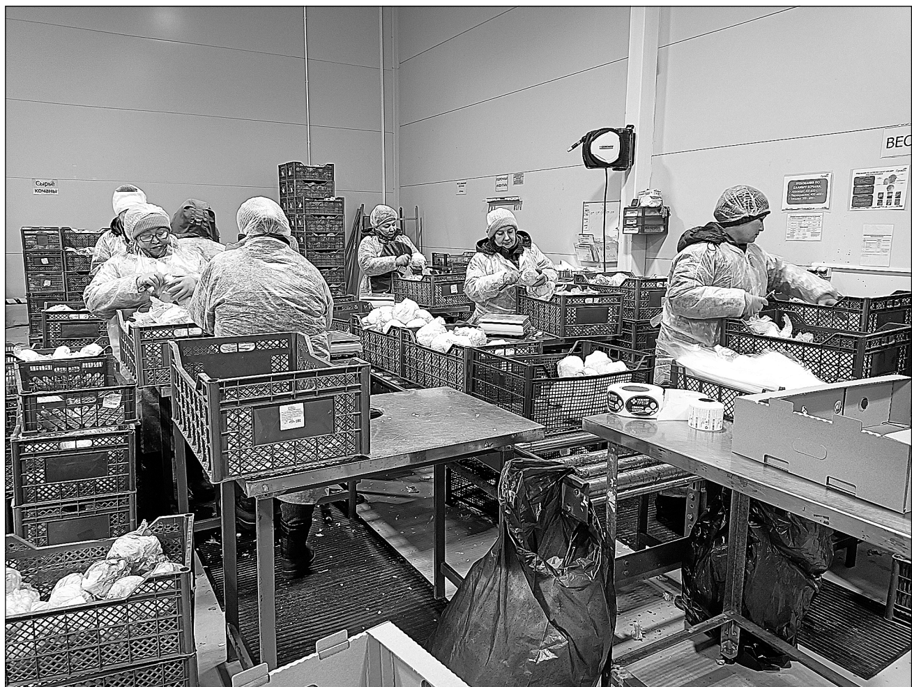
«Прованс» – один из резидентов индустриального парка «Боровский» – выпускает свежие салаты и салатные смеси.