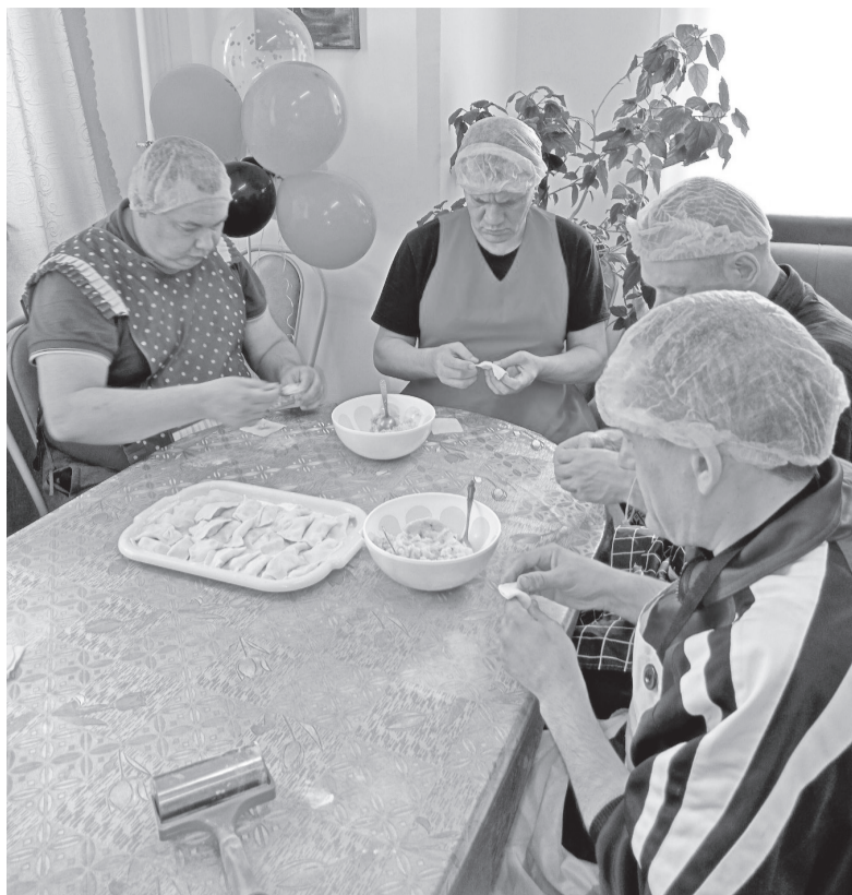
Учебно-тренировочный модуль «Кухня-гостиная»