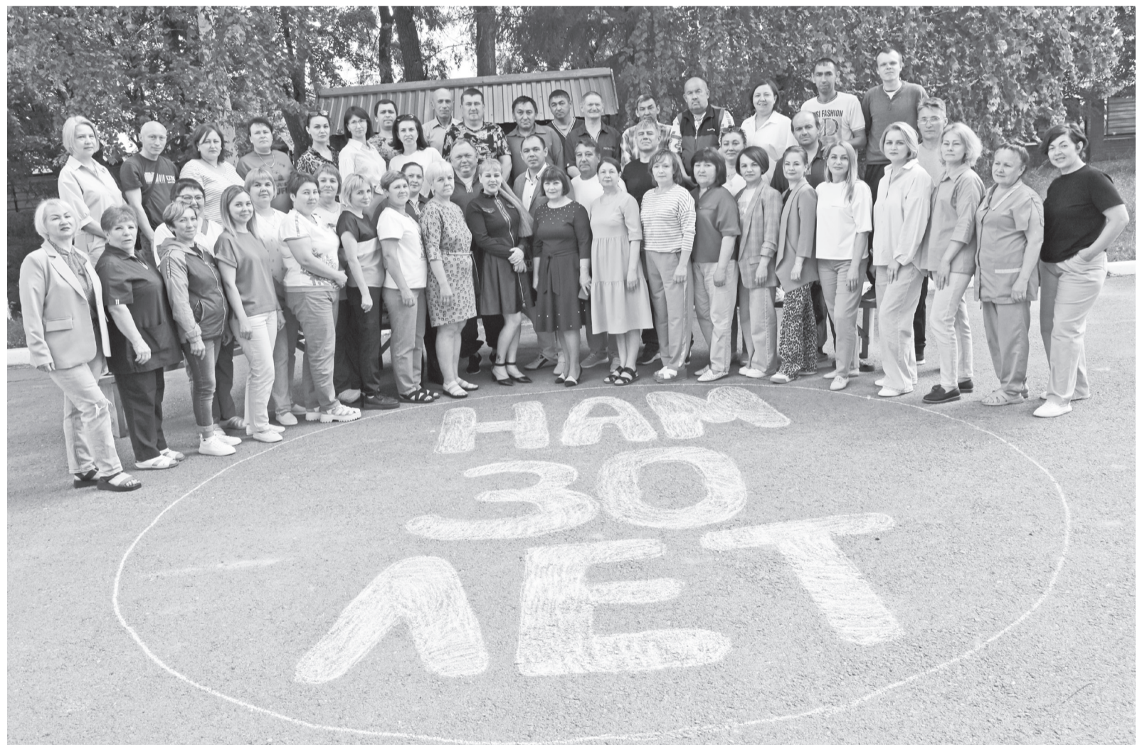
Коллектив Зареченского дома социального обслуживания

же жителям подтопленных территорий, вступают в волонтерские отряды и даже работают.