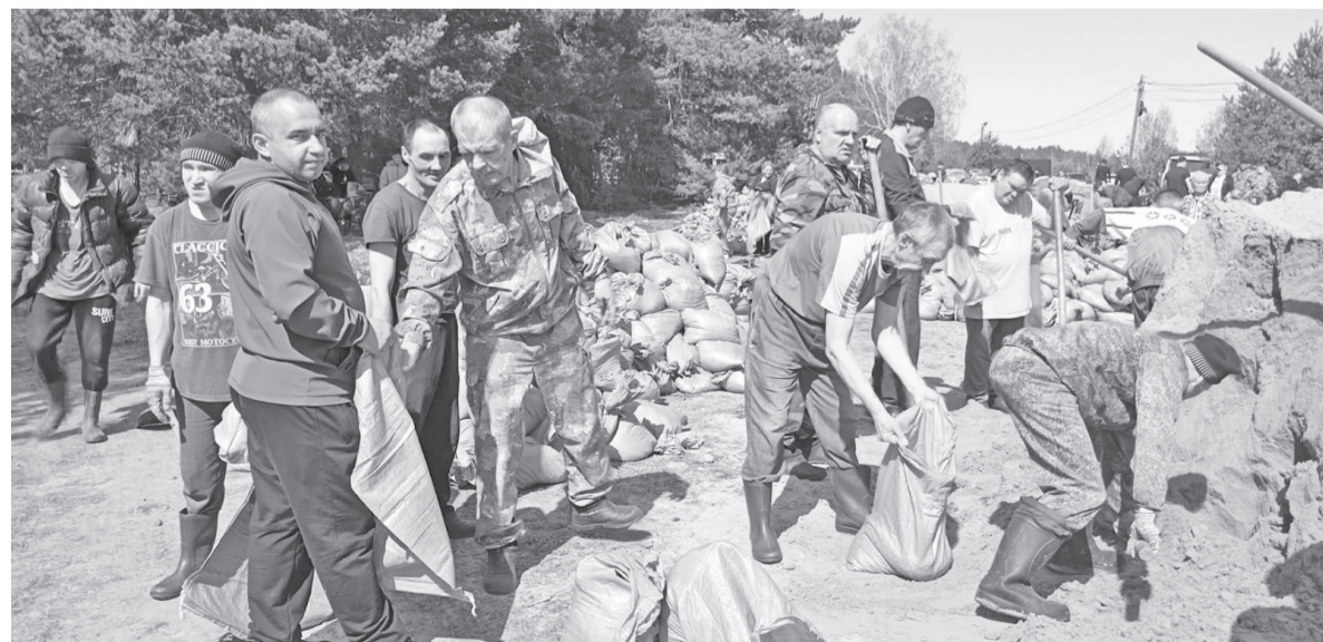
Затаривание мешков для подтопленных территорий района

коллектива стало признание его лучшей организацией, предоставляющей услуги в стационарной форме, в региональном этапе Всероссийского конкурса профессионального мастерства «Успех года» в номинации «Стабильность и качество».