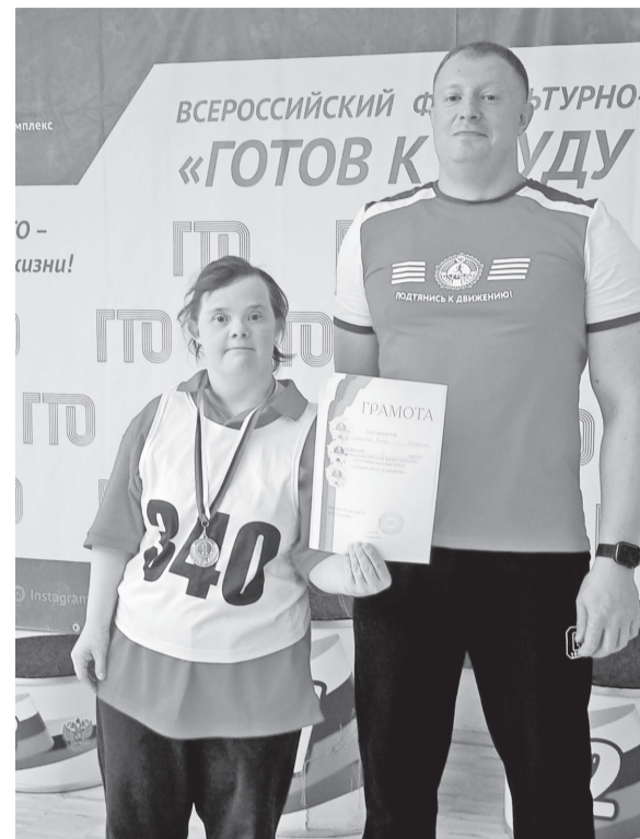
Сдача норм ГТО

га есть талант рисования, он является неоднократным победителем конкурсов художественного творчества не только регионального значения, последним его достижением стало участие в инклюзивном многожанровом конкурсе искусств «Особые таланты-2023» национального Фонда развития реабилитации, г. Москва, и как результат – третье место в номинации ИЗО.