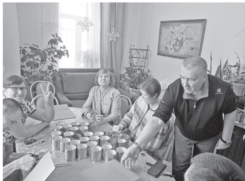
Изготовление окопных свечей