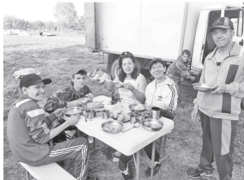
Программа «Социального туризма»

Да и сам коллектив всегда держит руку на пульсе, имеет многочисленные благодарственные письма за достижения высоких показателей качества оказания услуг в сфере социального обслуживания. В 2021 году в творческом конкурсе «Праздник в каждый дом», организованном благотворительным фондом «Старость в радость», г. Москва, они получили диплом первой степени. В этом же году в рамках реализации системы долговременного ухода за гражданами пожилого возраста и инвалидами в Тюменской области в номинации «Культура здоровой жизни» они стали лучшими. Одной из последних побед