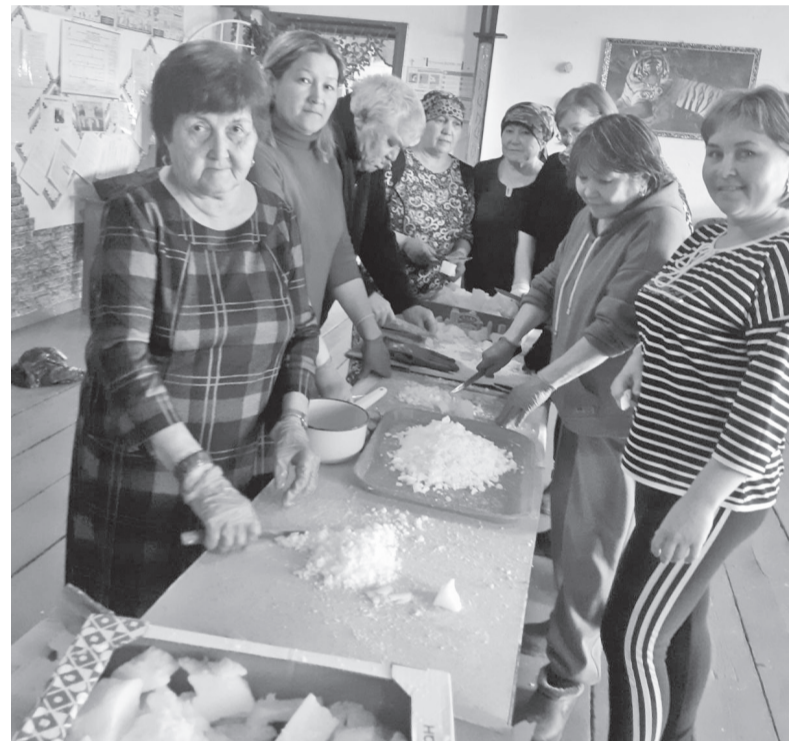
Окопные свечи всегда пригодятся на передовой

В мае наши активисты пришли на мастер-класс по изготовлению сухого армейского душа для наших ребят на СВО. Сухой армейский душ – это гигиени-