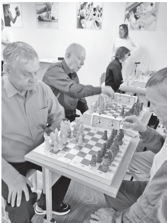
Спартакиада психоневрологических интернатов Тюменской области