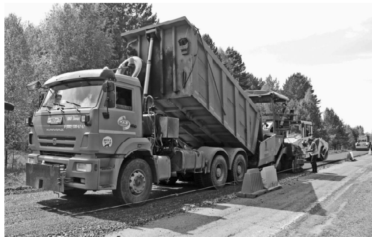
› Разгрузка дорожного материала