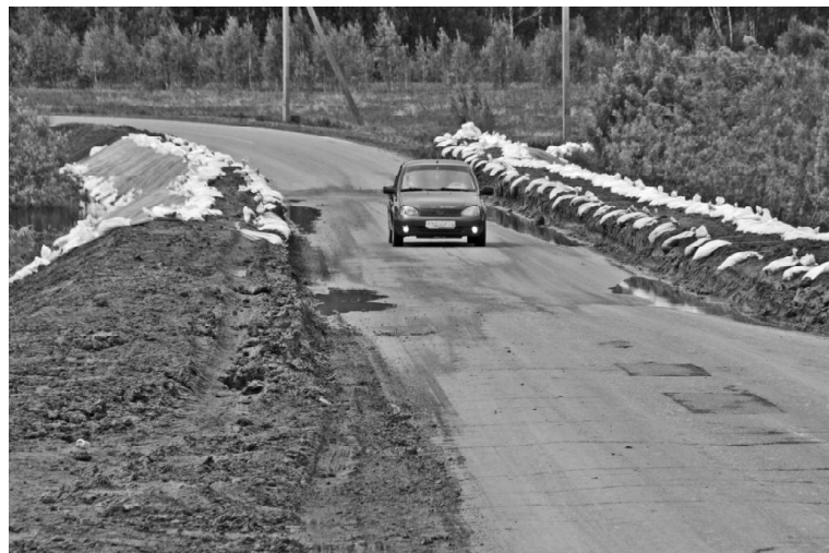
› Укрепление участка дороги из Викулово в Чебаклей

В настоящее время от жителей этих населённых пунктов поступило 344 заявления на выплату материальной помощи. По 219 из них принято положительное