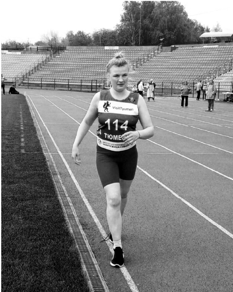
➤ Наталья Бендюкова

Всего в копилке викуловских паралимпийцев 11 медалей: 6 золотых, 2 серебряных и 3 бронзовых.