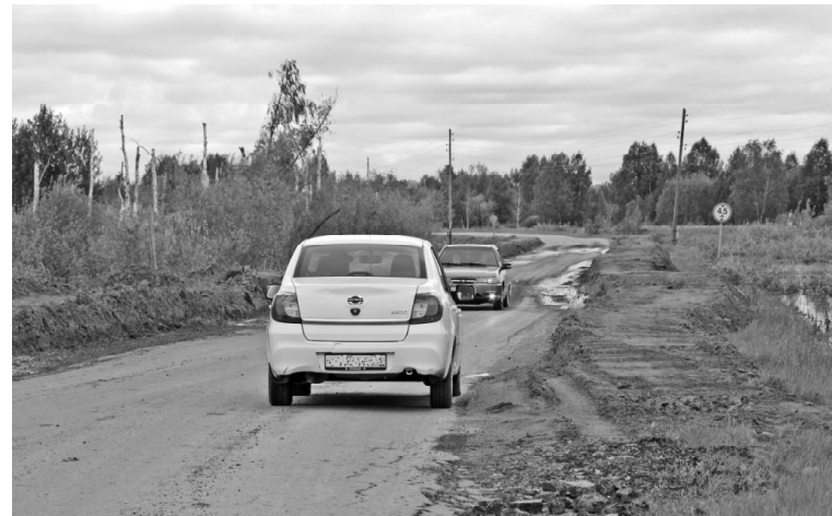
› Участок дороги Викулово-Борки

решение. 125 заявителей не подтвердили проживание на данной территории. Что касается сёл Долгушино и Бобры, то в отношении материальной выплаты жителям этих населённых пунктов вопрос решается.