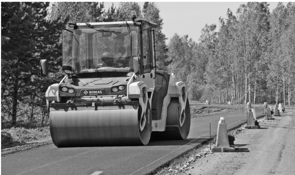
› Работает каток