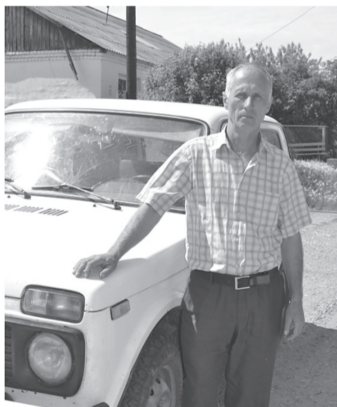
Для общения - несколько минут. Ждёт работа.

— А как строился ваш рабочий день в весеннюю страду?