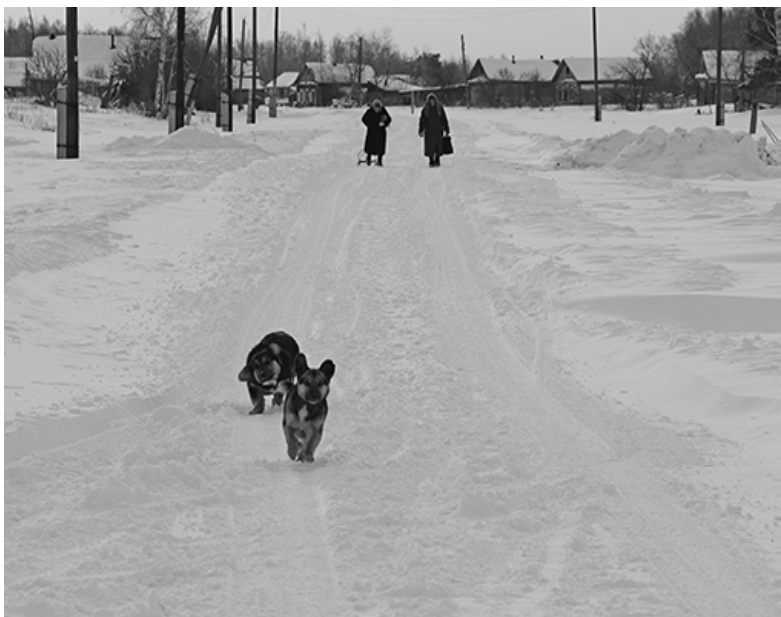
* Прогулка по деревне.

Производим и реализуем п/м хвойных и лиственных пород, делаем расчёт п/м на строение. Доставка. Наличный и безналичный расчёт. Продам «КамАЗ 43105»-лесовоз, пилораму «ДПУ-600», оцилиндровочный станок, четырёхсторонний станок. Обр.: т. 8 9043202627.