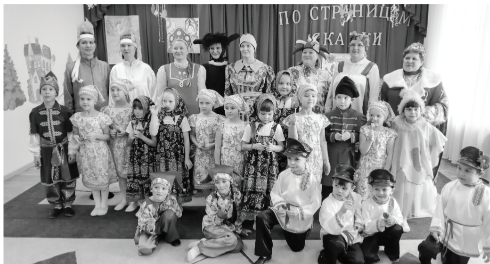
Дети пели песни, танцевали, играли с любимым персонажем в игры. Родители, посетившие ярмарку, тоже не остались в стороне.

В адрес работников детского сада прозвучало немало благодарных слов от родителей за прекрасный семейный досуг.