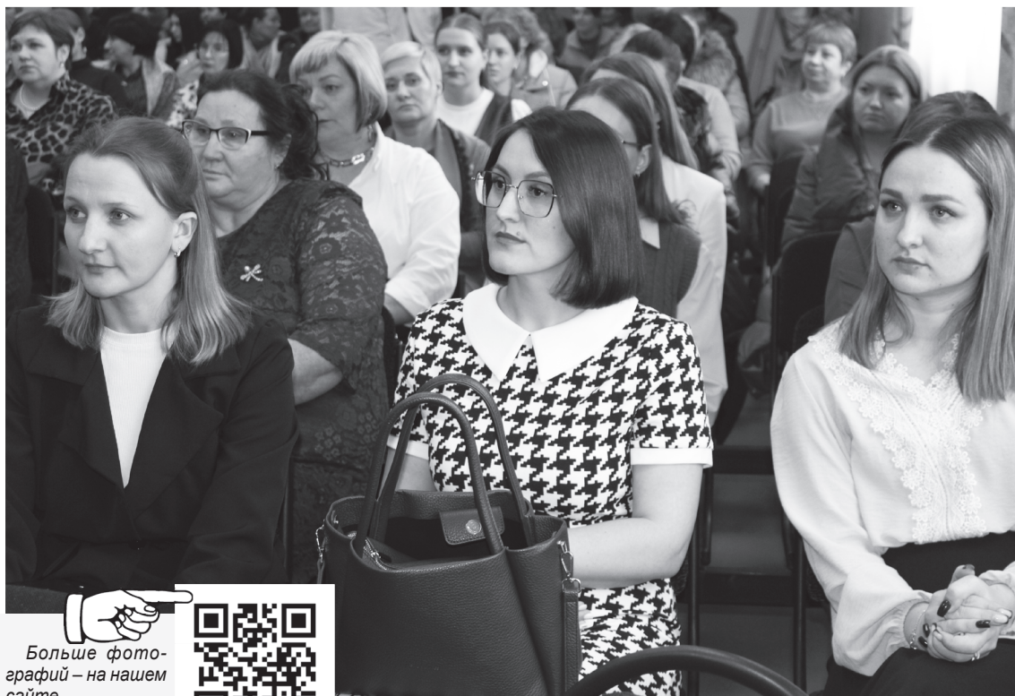
В зале Лесновского СДК – конкурсанты и их коллеги