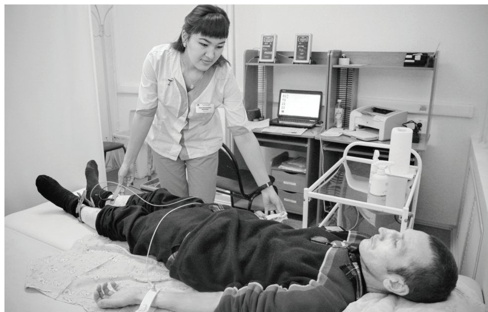
Очень важно своевременно обследоваться и поддерживать здоровье – тогда и диабет не страшен.

– Но важно понимать, что придётся кардинально изменить образ жизни. А именно