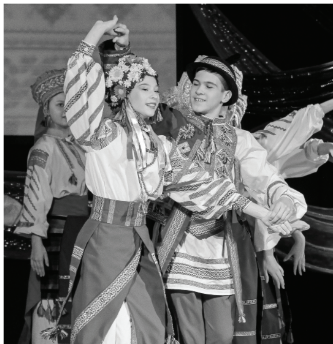
Концертную программу подготовили творческие коллективы ГДК и активисты национально-культурных объединений. // Фото Василия БАРАНОВА.

Праздничный женский наряд Олонёцкой губернии Каргапольского уезда первой половины 19 века изготовлен для фестиваля «Славянский базар» в Тюмени.