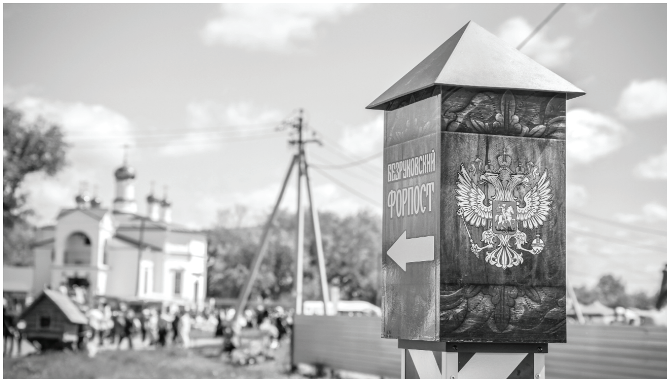
Фестиваль народного творчества стал брендом не только Дымковского поселения, но и Ишимского района в целом.