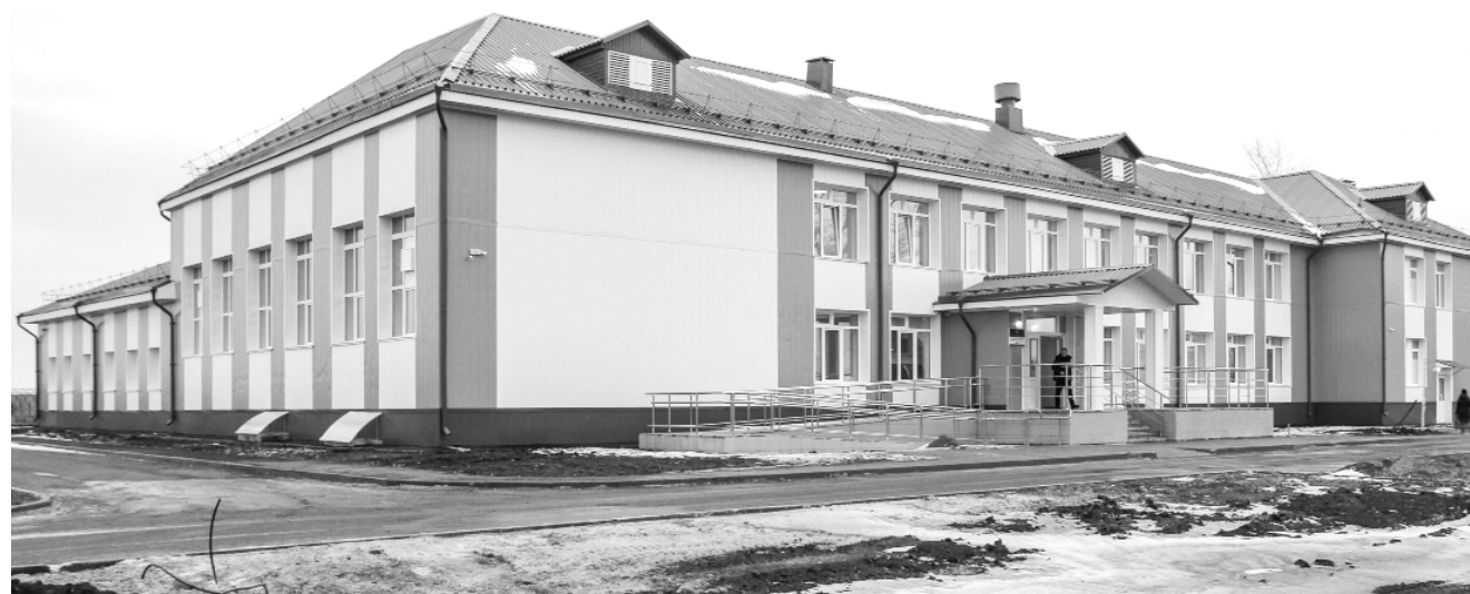
С ноября ребята из Ершово и близлежащих деревень продолжили занятия уже в своей, обновлённой, современной школе.