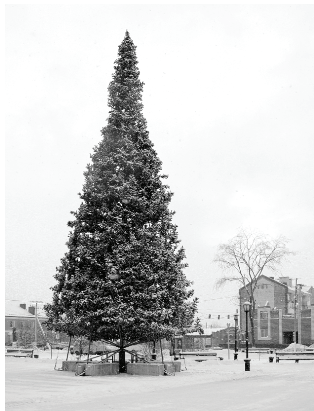
Тринадцатиметровую ель скоро украсят шарами и гирляндами.