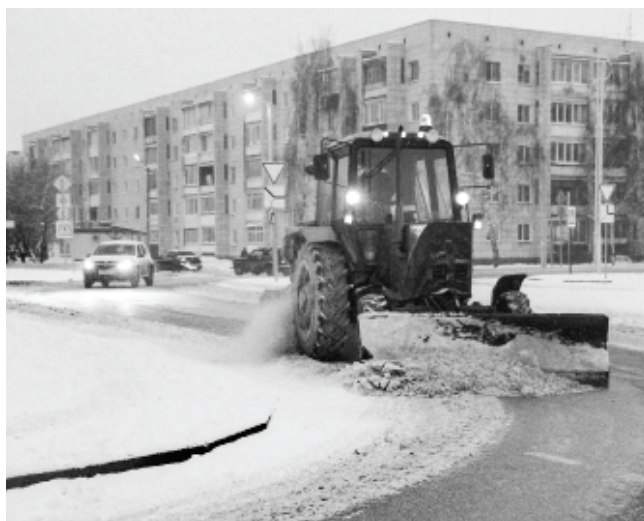
Чтобы в городе не скапливались снежные завалы, САХ сразу вывозит собранный снег на полигон на ул. Заречной. За последние сутки туда отправлено 50 машин.

На выходных прошёл первый за эту зиму настоящий снегопад. Рабочие и техника «Спецавтохозяйства» сразу вышли на уборку города.