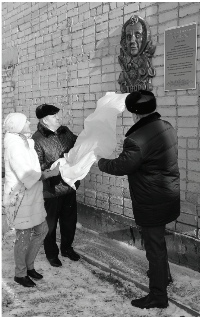
На улице Суворова появился новый арт-объект.