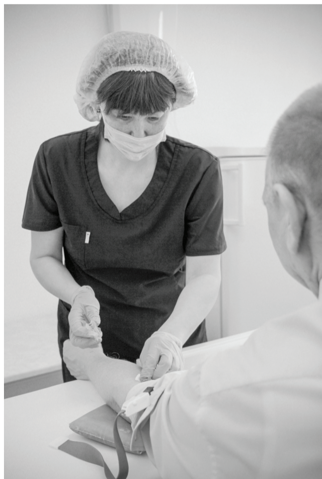
Анализ на ВИЧ бесплатный и анонимный, сделать его можно в любом лечебном учреждении.

– Есть три способа заражения ВИЧ: половой, «наркотический» и вертикальный – от матери к ребёнку. Если в начале 2000-х годов преобладал «наркотический» путь – через внутривенное употребление наркотических средств, то с 2005 года начал расти половой путь распространения, сегодня он составляет 60 %, – рассказал врач-эпидемиолог