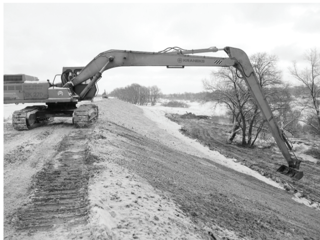
На восстановлении дамбы задействовано 3 экскаватора и 7 самосвалов.