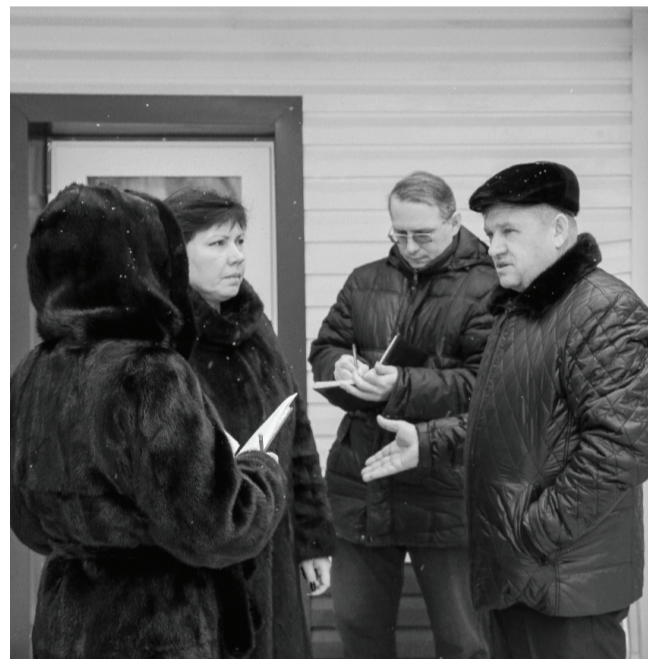
В следующем году в пяти детских садах будут заменены инженерные сети.

Руководитель муниципалитета заверил: ремонтные работы в садах будут проводиться без прерывания воспитательного процесса.