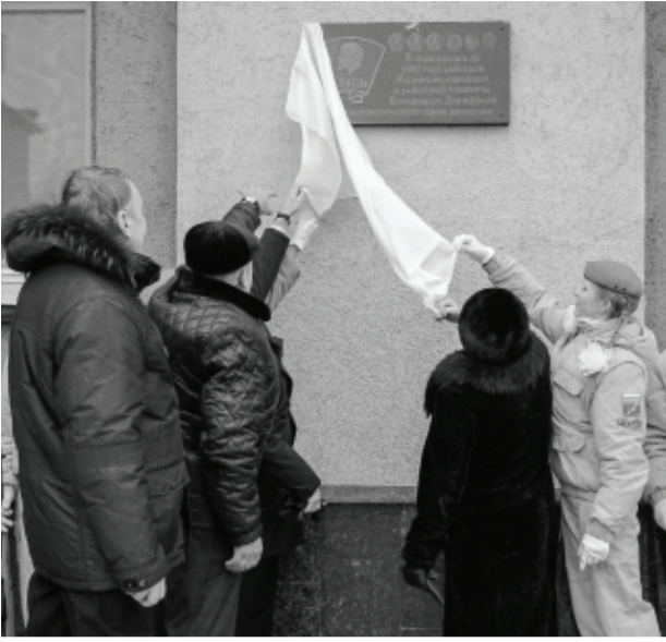
Памятная доска на здании городской администрации напоминает о том, что здесь до 1992 года располагались городская и районная комсомольские организации.