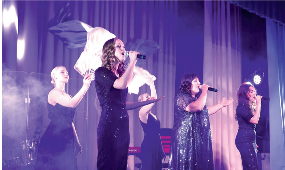
► У фестиваля будет своя песня