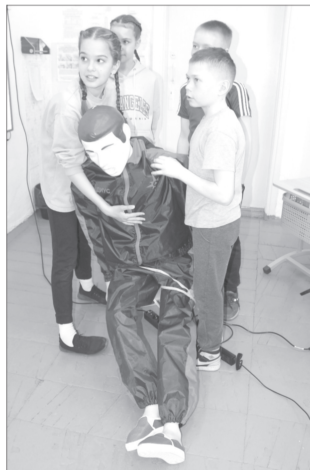
Ребята из Памятного не сразу вспомнили, как помочь пострадавшему с инородным телом в дыхательных путях

Теория и практика. Программа конкурса не изменилась, внесены лишь небольшие новшества в некоторые этапы состязаний. Например, добавлено тестирование к заданиям по оказанию первой помощи. Лишь после ответов на вопросы участники были допущены к практической части. За компьютером юные знатоки сдавали и правила дорожного движения.