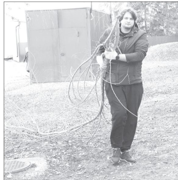
В четверг в Ялуторовске субботники провели многие организации и предприятия, среди них «Стройзаказчик» и городская администрация

Третий год по новой схеме. Принципиальное отличие заключается в организации вывоза всего собранного. Коренные ялуторовчане хорошо помнят, что раньше мешки с мусором выставляли на обочинах дорог в ожидании машин коммунальных служб, которые приезжали в разные части города по определённому графику. Этого нет уже несколько лет. Люди поворчали и привыкли. Мешки нужно доставлять к площадкам с мусорными баками, но так, чтобы не перекрыть к ним проезд и подход.