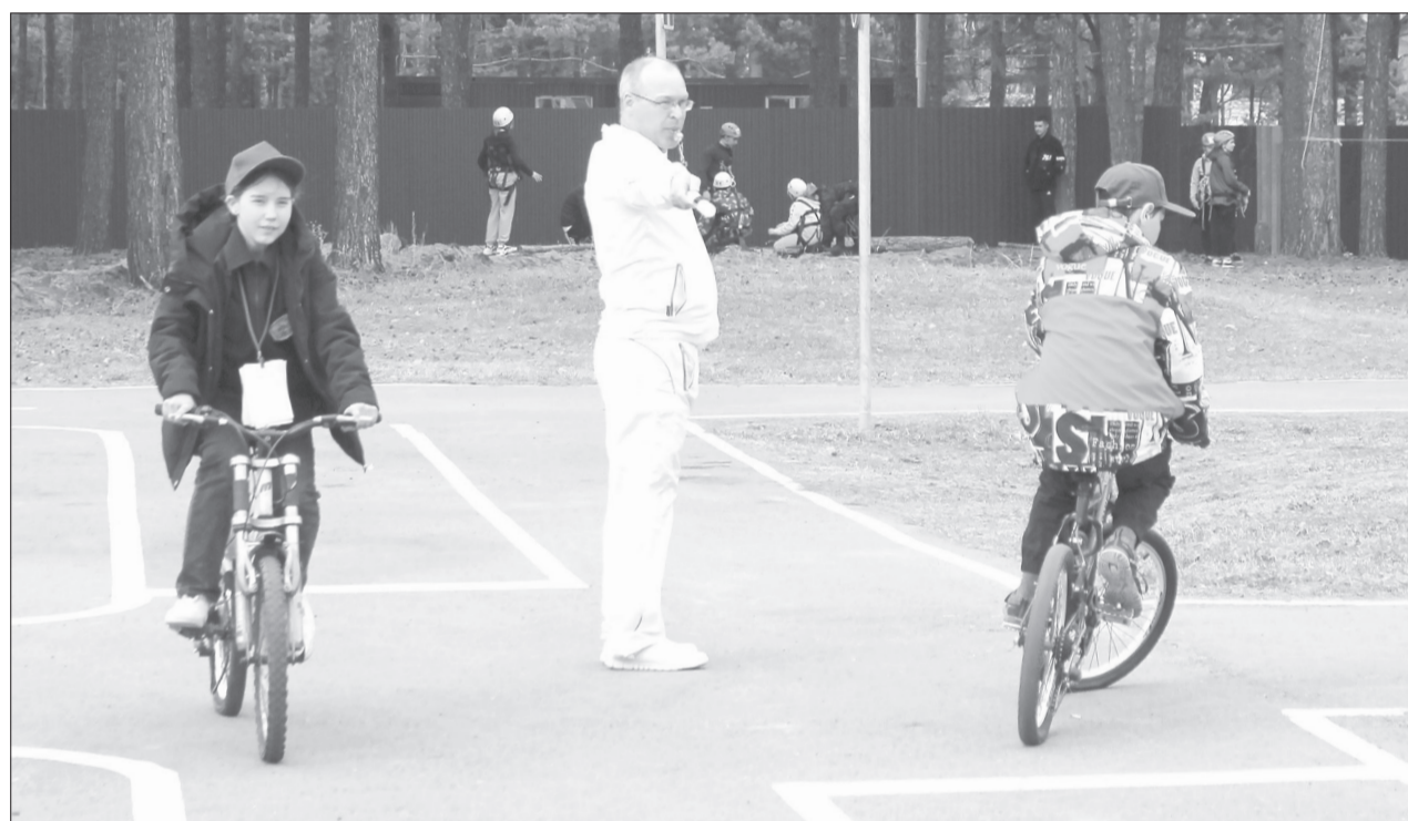
На этапе «Автогородок» было важно не запутаться в дорожных знаках, разметке и сигналах регулировщика

В районе выбрали лучших знатоков правил дорожного движения