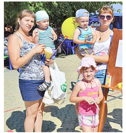
Любая выплата на детей облегчает жизнь малышам и мам

Кроме того, в случае, если заявитель в 2020 году и (или) трудоспособные члены его семьи признаны в установленном порядке безработными, выплата назначается (до 31.12.2020 г.) без учёта ранее полученных гражданином, признанным безработным, доходов от трудовой деятельности, т.е. не будет учитываться доход по предыдущему месту работы того родителя, который после 1 марта 2020 года был признан безработным.