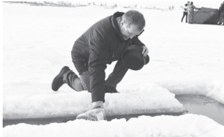
|| В Крещение исетцы окунались в иордань и набирали святую воду.