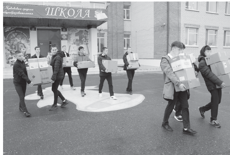
Ученики Ярковской школы и их родители собрали 45 посылок для мобилизованных земляков

В Ярковском районе продолжается сбор гуманитарной помощи для мобилизованных земляков и жителей освобождённых территорий. В этот процесс включились многие предприятия и учреждения нашего муниципалитета. Среди них – педагогический коллектив Ярковской средней школы. На одном из совещаний здесь решили организовать акцию «Своих не бросаем». В этот же день классные руководители обсудили вопросы, связанные со сбором посылок для наших мобилизованных земляков, в родительских чатах.