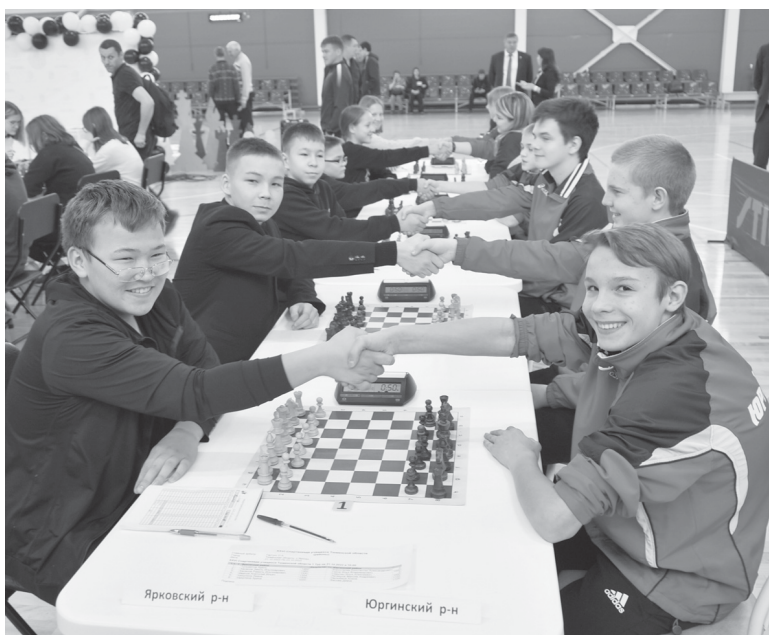
Традиционное знакомство с соперниками перед началом соревнований