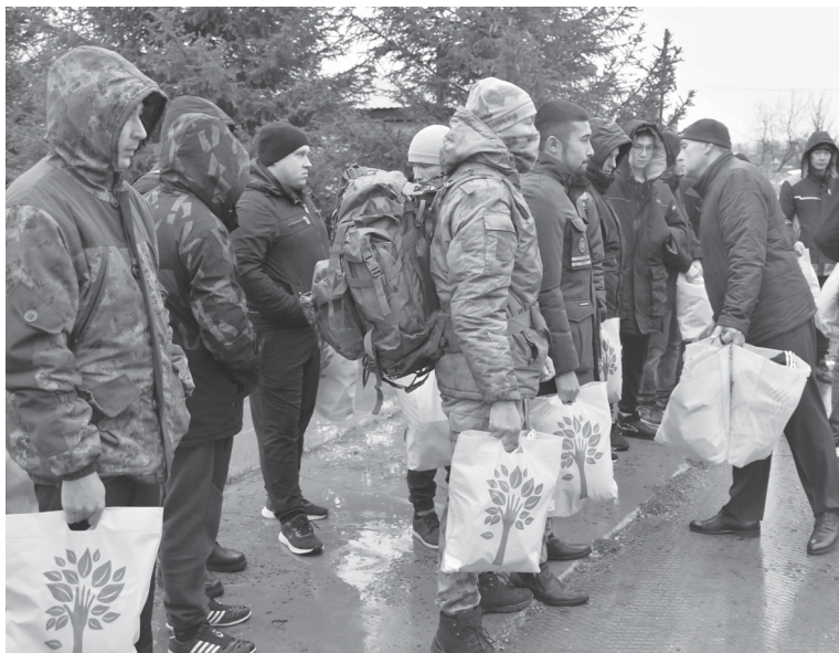
Из родного района мобилизованные уехали не с пустыми руками

Помимо этого, в Тюменской области продолжает работать горячая линия для родных мобилизованных: её телефон 8-800-201-4141. Специалисты-психологи, работающие в круглосуточном режиме, готовы не только оказать экстренную психологическую помощь, но и стабилизировать эмоциональное состояние звонящих, а в дальнейшем, при необходимости, предложить им пролонгированную помощь. Телефон горячей линии в Ярково районе: 8-958-150-73-89.