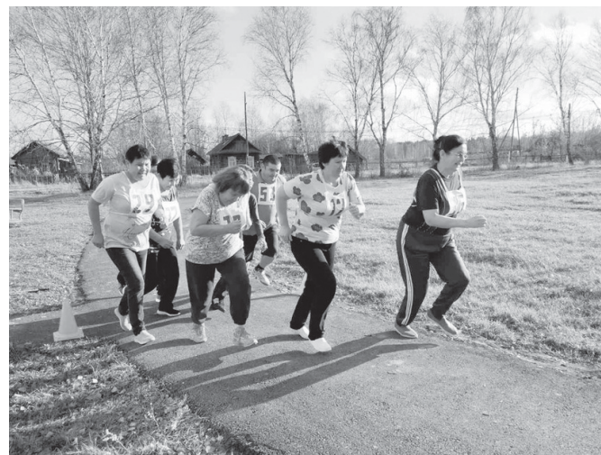
На старте – педагоги Маранской школы

Владислав ЗАХАРОВ, фото из архива МАУ ДО «ДЮСШ Ярковского района»