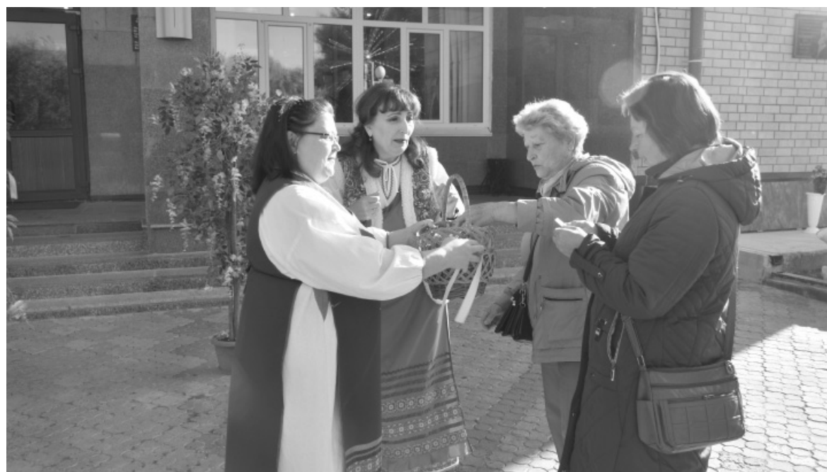
Перед началом праздника все могли загадать свои желания

Пришедшие на праздник бабушки и дедушки могли найти себе занятие по душе: в малом зале ДК проходили мастер-классы «Осенняя композиция», «Чайная церемония», «Праздничный магнит», «Подарок своими руками». Вместе со специалистами Дома культуры, библиотеки и молодежного центра бердю-