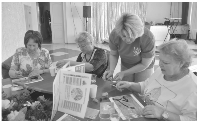
Для гостей праздника работали творческие площадки и палатка здоровья