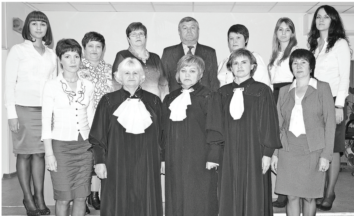
Коллектив Нижнетавдинского районного суда.

Это большая дата, солидный возраст органа, осуществляющего правосудие в районе.