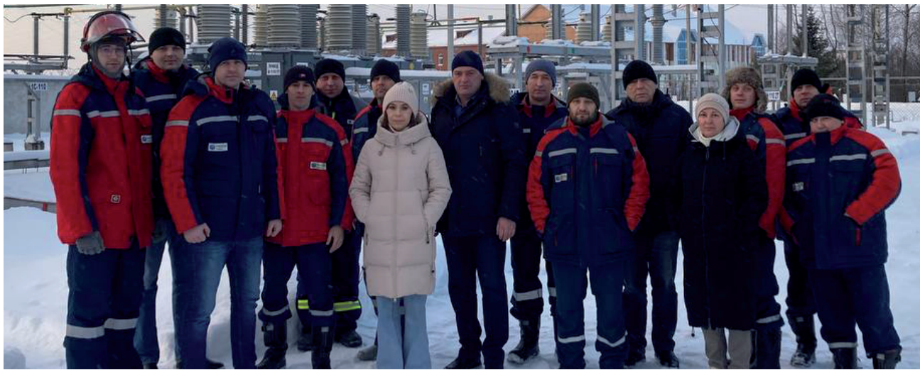
Коллектив Уватского участка АО «Россети Тюмень».