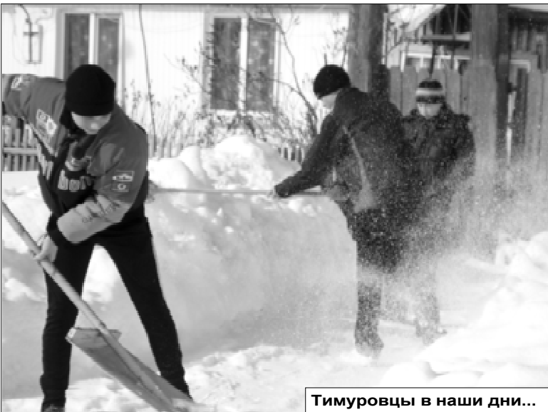
Тимуровцы в наши дни...