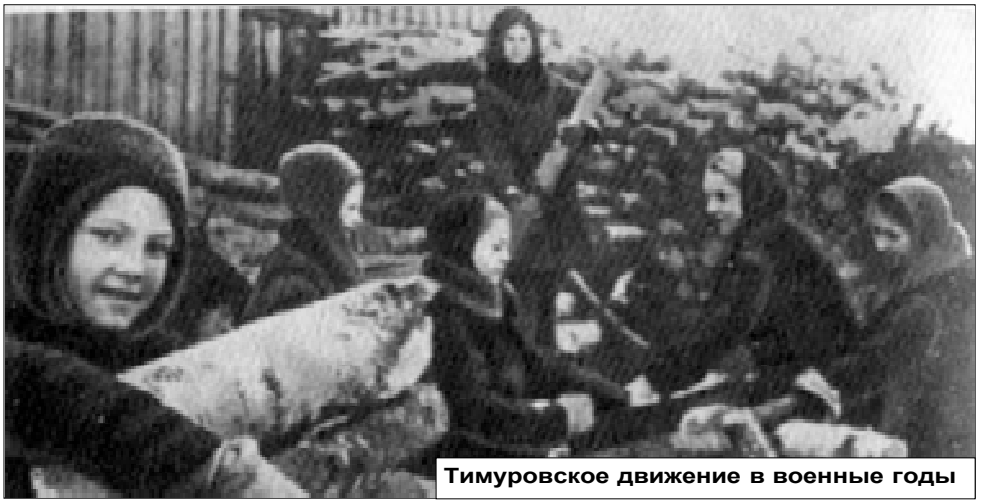
Тимуровское движение в военные годы

Во время летних каникул школьники вместе с колхозниками вышли на борьбу с сорняками. В газете проходит заметка, в которой говорится, что