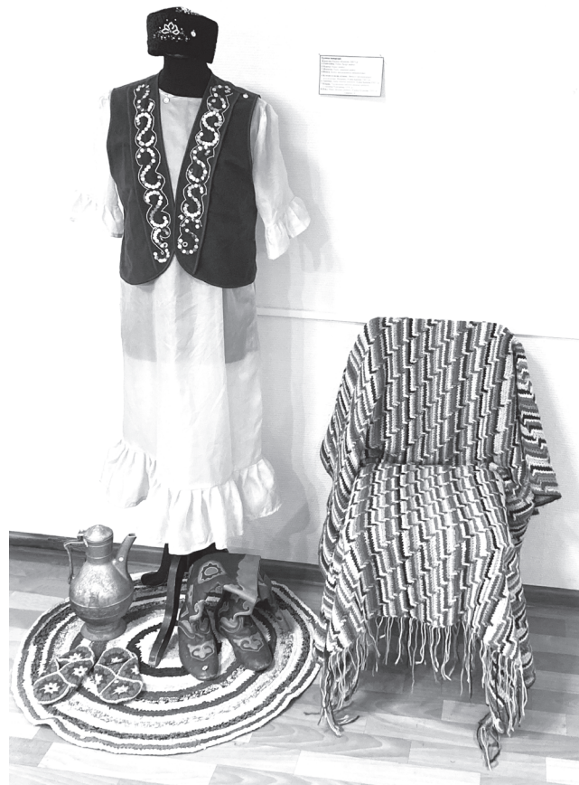
На выставке «Из провинции с любовью» были представлены: женский наряд, символ татарского дома кумган и работы укинских мастериц.