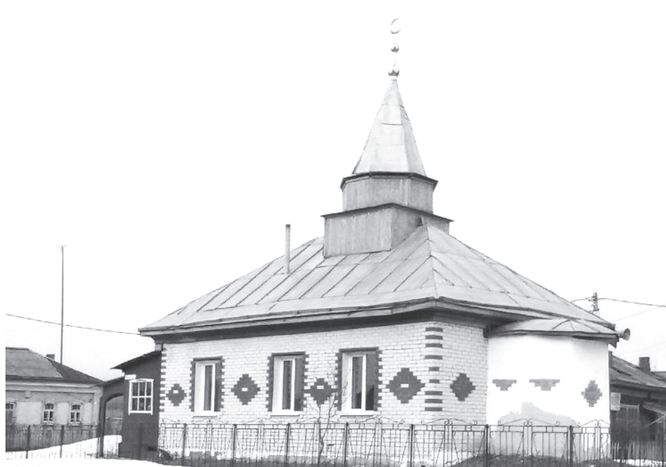
Укинская мечеть - единственная в Уватском районе.

Укинская мечеть - единственная в Уватском районе. Во время религиозных праздников сюда приезжают верующие со всех окрестных сел и поселков. В первые годы советской власти религиоз-