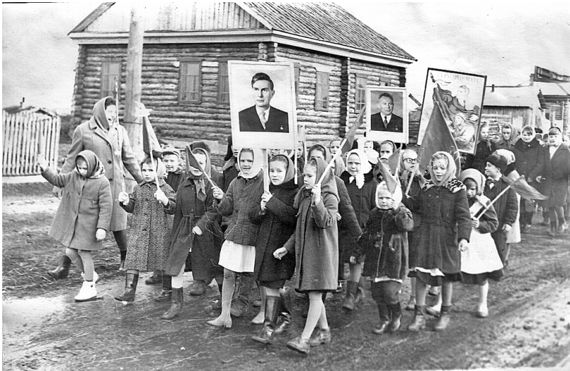
Празднование 51-й годовщины Октябрьской социалистической революции (Копотилово, 7 ноября 1968 года)