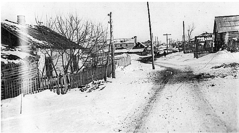
Село Казанское, улица Октябрьская (1970-е годы)