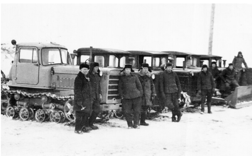
Гусеничные тракторы, работавшие на полях в 50-е годы прошлого века