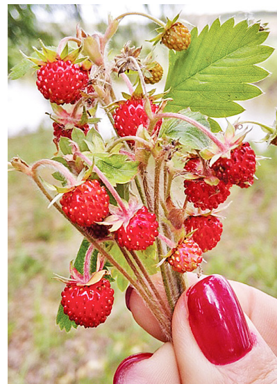
Щедро делится с нами лес своими дарами: грибами, лекарственными травами, ягодами

В Казанском районе живут мои родители, родственники, друзья. Я люблю родной край летом, когда всё расцветает, благоухает, когда можно хорошо отдохнуть и набраться сил к учебному году. Хорошо тут зимой: природа становится такой таинственной и непредсказуемой, в лесу – красота неопишная и дышится как-то по-особенному.