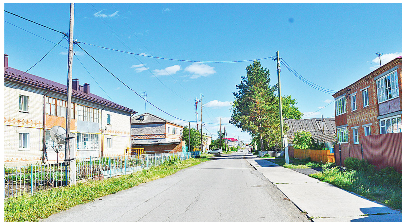
Улица Октябрьская в наши дни