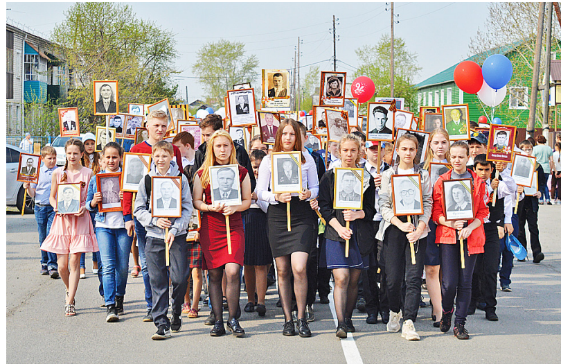
Учащиеся Казанской школы – активные участники акции «Бессмертный полк» (9 мая 2019 года)