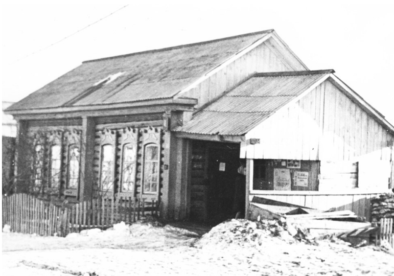
Книжный магазин, располагавшийся на улице Ленина в райцентре. 1970-е годы