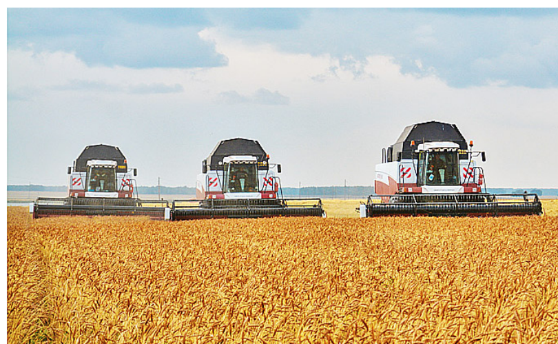
Современная мощная зерноуборочная техника позволяет эффективно развивать агропромышленный комплекс района