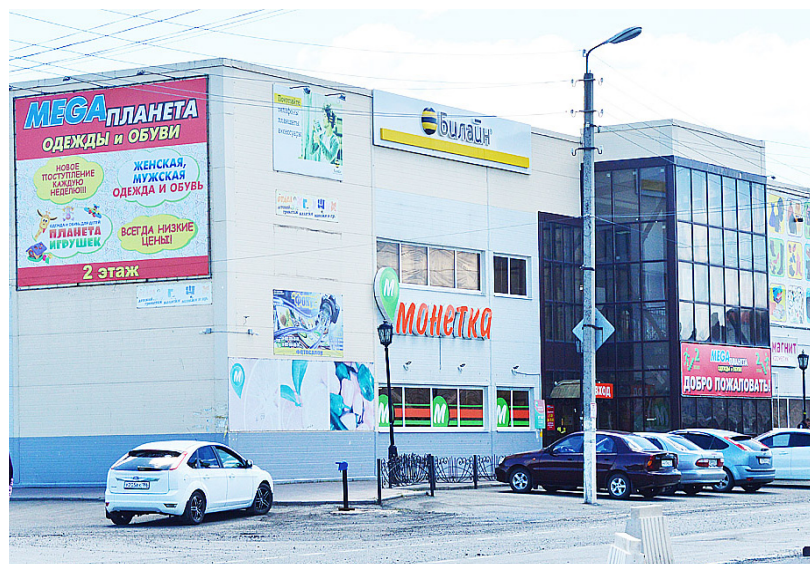
Торговый центр, построенный на улице Луначарского в селе Казанском