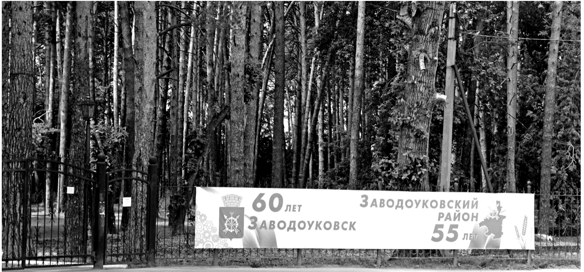
• Традиционный день города заводоуковцев празднуют в конце июня. В этом году торжество могут перенести.