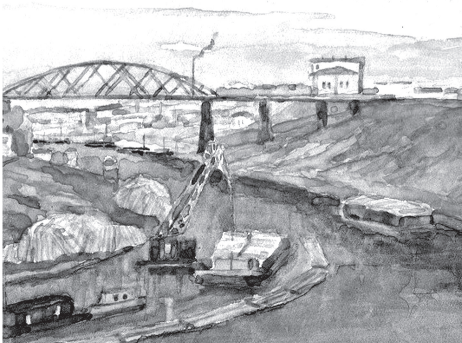
• Александр Митинский «На реке Туре». 1962 год.